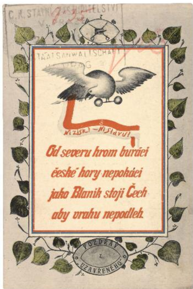
Obr. 6. Pohlednice (dle nákresu J. Sobotky) vydaná Tělocvičnou jednotou Sokol v Chabařovicích u Ústí nad Labem, přelom 19. a 20. století. Národní muzeum – Historické muzeum, oddělení starších českých dějin, inv. č. H2-3744.

Postupná nacionalizace společnosti, prostupující všechny sféry života, našla svůj odraz také ve vnímání a využívání krajiny. Nacionalizace krajiny se tak stala součástí dobového diskursu. Zajímavým příkladem je samotný Říp – zatímco v roce 1868 se velkého řípského tábora účastnila ještě řada německých rolníků z okolních okresů Čech, o dvacet let později byla již tato hora vnímána jako „hráz proti německému živlu“. Nacionálně motivovaný zápas o národní prostor zde byl výrazně podpořen již zmíněnou hraniční polohou regionu, 65 jež byla pasována na symbol opory národní identity. V poezii Svatopluka Čecha tak již hora stojí osaměle vzdorujíc „vlnám cizáckého moře“, 66 Jaroslav Vrchlický ji pojímá