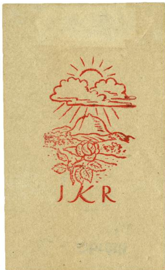
Obr. 7. Památná hora Říp na exlibris Jarmila Krecara, V. H. Brunner, 45 × 25 mm, zinkografie, [1924]. Knihovna Národního muzea, oddělení knižní kultury, inv. č. Exlibris 3117.

Postupná nacionalizace společnosti, prostupující všechny sféry života, našla svůj odraz také ve vnímání a využívání krajiny. Nacionalizace krajiny se tak stala součástí dobového diskursu. Zajímavým příkladem je samotný Říp – zatímco v roce 1868 se velkého řípského tábora účastnila ještě řada německých rolníků z okolních okresů Čech, o dvacet let později byla již tato hora vnímána jako „hráz proti německému živlu“. Nacionálně motivovaný zápas o národní prostor zde byl výrazně podpořen již zmíněnou hraniční polohou regionu, 65 jež byla pasována na symbol opory národní identity. V poezii Svatopluka Čecha tak již hora stojí osaměle vzdorujíc „vlnám cizáckého moře“, 66 Jaroslav Vrchlický ji pojímá