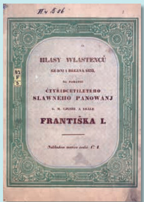
Hlas vlastenců ke dni 1. března 1832 , první publikace vydaná v nakladu Matice české, tisk a papír firmy Synové Bohumila Haase . Do typograficky skvěle zpracovaného díla přispělo patnáct českých básníků. Knihovna Národního muzea, sign. 84 E 45, titulní list.