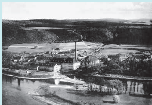
Strojní papírna ve Vraném nad Vltavou , celkový pohled z roku 1903. V popředí ostrov, který zanikl po výstavbě vranské přehrady v roce 1935.