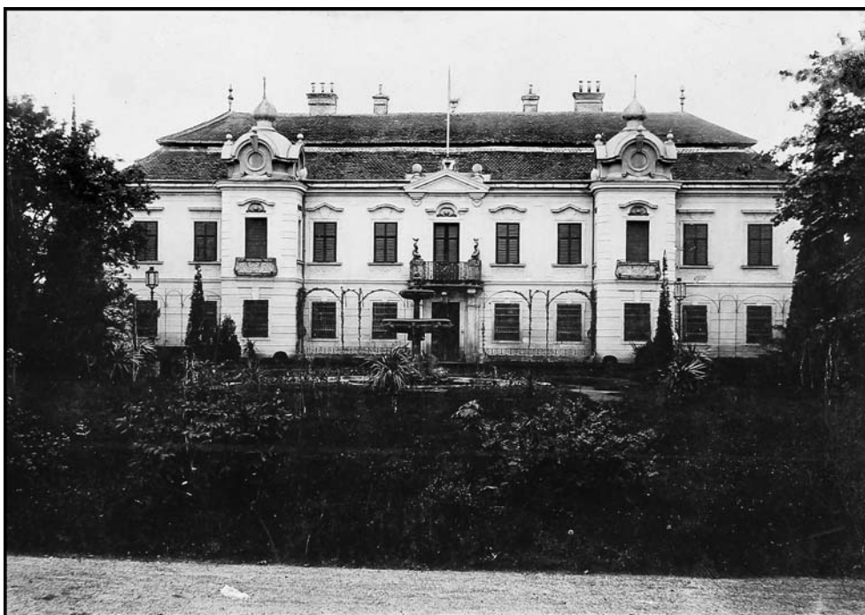
Lechovice. Zámek. 1901. Fotografie (15,1 x 19,7 cm). Moravská zemská knihovna v Brně, Schramova sbírka vedut, sign. Skř.1-0091. 416,814.