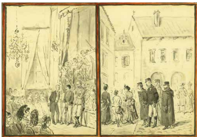
Obr. 7. Návštěva v Uherském Hradišti.