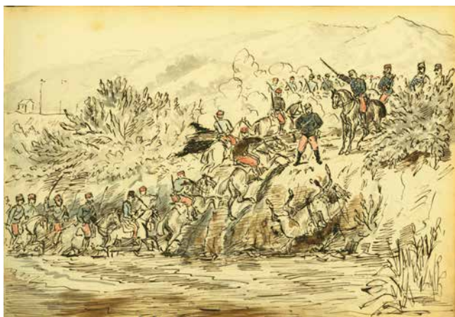
Obr. 3. Dragouni při překonávání řeky.

příhody z autorova mimoslužebního života – výlety s jinými důstojníky či s manželkou. Velmi často na obrázcích nakreslil sám sebe, se svým typickým dlouhým visícím knírem, jako např. 22. 11. 1875, kdy ukazuje své album důstojníkům brigádní důstojnické školy s poznámkou, že šlo o „pozoruhodný moment“. 9 Kresby i komentáře mají často vtipný či ironický charakter, autor glosuje události s více či méně povedeným „vojáckým“ humorem. Vzhledem k rozsahu tohoto článku dále uvádím jen stručný výběr charakteristických scén.