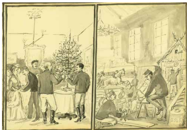
Obr. 10. Plukovní oslava Vánoc a příprava cirkusového představení.

s kroutící hlavou a s přesvědčením, že jsem asi blázen.“ 31 Dne 24. 10. 1875 zase autor komentuje: „Patří k příjemnostem Prostějova, že když člověk jednou v roce přijde domů o půl dvanácté v noci, téměř všechny pouliční lucerny jsou zhasnuté, člověk musí v dešti stát půl hodiny a křičet a /teprve/ nakonec, když několikrát hodí /kamínky/ do okenních tabulek, se dostane do domu. Od domu existuje jen jeden klíč, váží 4 libry a je dlouhý 1 ½ stopy.“ 32 A jindy zase kreslí, jak ho při návratu z Brna fiakrista vyklopil před jeho domem ze saní. 33 Vůbec návraty z cest připravily Mensdorffovi zajímavé zážitky. Na kresbě z 27. 7. 1875 ho pronásledují čertíci a jiná strašidla, což doplňuje komentářem: „Jedu z Čechovic ... v noci domů, mé temné myšlenky se odrážejí v temnotě noci.“ 34 Také při další cestě na koni (17. 9. 1875), tentokrát z Olomouce do Prostějova, pozdě večer poté, co vyšel úplněk, zpozoroval v úvozu „ošklivého malého černého mužíčka, který na kraji cesty běžel právě tak rychle, jak já jsem jel. Perla se tím vydělala a kdykoliv skočila, vyskočil malý mužíček potěšením vzhůru. Teprve když jsem vyjel z úvozu,