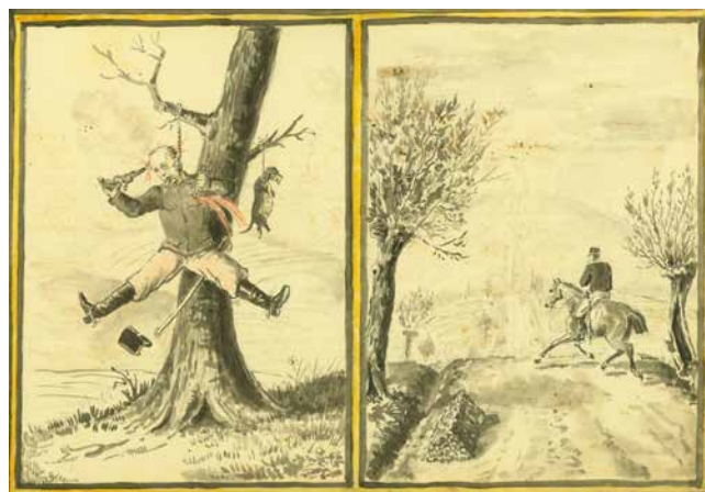
Obr. 6. „ Jediný dobrý žert, který by se dal v Prostějově udělat, kdyby se jen dal najít nějaký strom! Žádný strom k oběšení, žádná patrona k nabití revolveru, žádný ostrý nůž k probodnutí, žádná voda k utopení. “