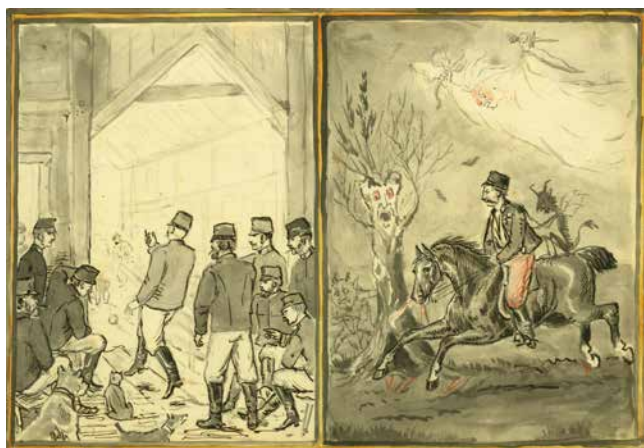
Obr. 5. Důstojníci pluku hrají kuželky a autor pronásledován „strašidly“.

Obrázek s datem 7. 10. 1875 zachycuje svého autora u hrobu kadeta Antona Aignera ve Věrovanech. Anton Aigner ze St. Georgen in Attergau padl v bitvě u Tovačova v roce 1866, Mensdorff přepisuje i příslušný nápis na kříži. 19 K 8. 6. 1874 zase Mensdorff zaznamenává, že vyhořel dům, kde bydlel v Prostějově nadporučík Körber. 20