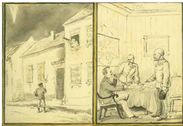
Obr. 2. Autor kreseb vyrušen ponocným při pozorování komety.