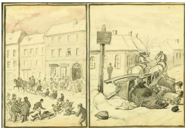
Obr. 9. Příhody se saněmi.