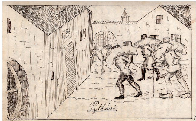
Obr. 2-11. Praskačka, č. 1-5. Jindřichův Hradec, 1864. Státní okresní archiv Jindřichův Hradec, Kulturně historický archiv, kart. 218.