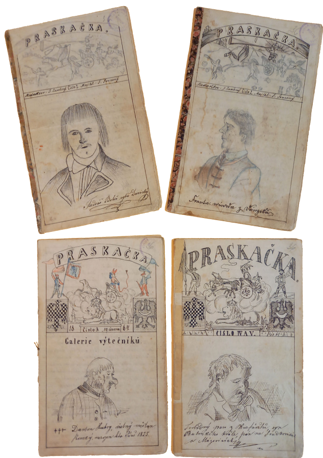
Obr. 1. Praskačka – titulní stránky dochovaných exemplářů. Jindřichův Hradec, 1864. Státní okresní archiv Jindřichův Hradec, Kulturně historický archiv, kart. 218.

ručně psaný studentský časopis „Praskačka“, který věnoval jindřichohradeckému muzeu českokrumlovský archivář František Navrátil.