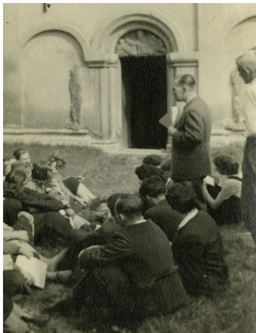
Obrázek 7 – V. M. přednáší studentům v exteriéru.

byla jeho kniha Česká architektura doby Lucemburské , tedy hlavně její kritika z pera dvou studentů, aktivních členů SSM, která se stala podnětem k jeho nucenému odchodu z pražské univerzity. Externě dojížděl přednášet i na Univerzitu Komenského v Bratislavě, kde skončil v roce 1953 jako nežádoucí opět z politických důvodů. Poté již vyučoval studenty pouze soukromě, snažil se jim předávat své zkušenosti alespoň při konzultacích, na vycházkách za architekturou i na exkurzích. Studenty zapojil nejen do již zmíněné práce na soupisech památek v historických jádrech budoucích městských rezervací, ale cestoval s nimi za lidovou architekturou Slovenska, zapojil je do výzkumů a zaměřování hradů a pevností na celém území Československa.