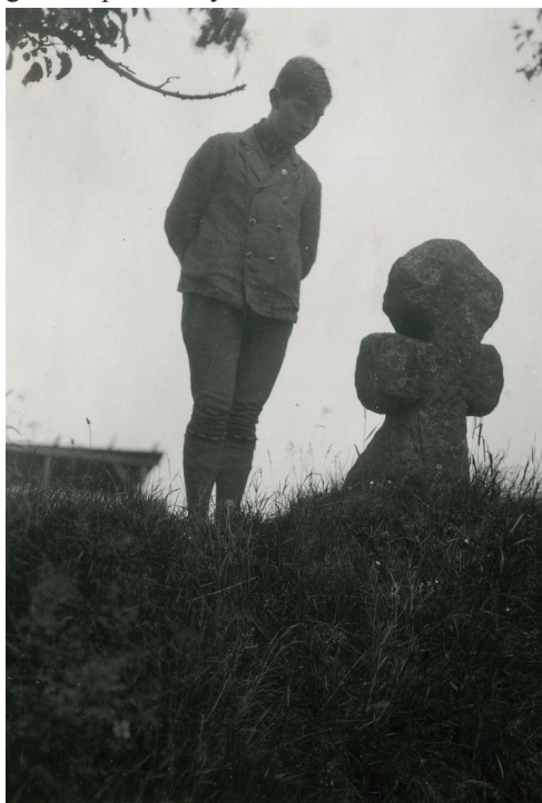
Obrázek 3 – V. Mencl v Pojizeří na studijní cestě v roce 1926.

Vzpomínky na tento výzkum i další působení na Slovensku vydal Mencl o padesát let později v sérii článků s názvem Ako sme začínali . 6 V roce 1926 se aktivně zúčastnil studijní exkurze lidové architektury do Pojizeří. Z této cesty se již dochovaly jeho konkrétní fotografie a poznámky. 7