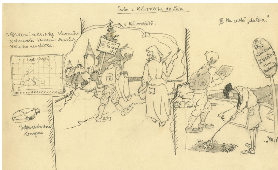
Obrázek 6 – Krátký komiks D. Menclové o cestě Menclůčků do Lána. ANM, f. D. a V. Menclovi, i.č. 3183_3.

pro ni zpracovala rekonstrukci kamenného opevnění Pražského hradu v době románské a navrhla velké množství modelů. O jejich intenzivní práci na výzkumu Pražského hradu i na samotné výstavě vypovídá velké množství plánů, které se nalézají v ANM. 25 V témže roce byl Mencl jmenován přednostou památkového odboru na ministerstvu školství a osvěty. A právě v té době připravovali Menclovi do tisku dodnes nevydané dílo Pražský hrad . Rukopis dedikovaný tehdejšímu prezidentovi Edvardu Benešovi byl odevzdán do tisku v roce 1947. 26 V ANM se dochoval včetně stránkové korektury, sazba ale byla po událostech roku 1948 rozmetána a v roce 1953 prezidentská kancelář nevydaný rukopis manželům vrátila. Po odevzdání rukopisu se v létě 1947 Menclovi vydali na velkou prázdninovou cestu se studenty do Francie, kde Dobroslava sbírala podklady pro francouzské hrady, opevnění a zvláště donjony. Poznámkový materiál lze opět dohledat v ANM, kde shromážděné materiály k evropským hradům zabírají celých patnáct kartonů.