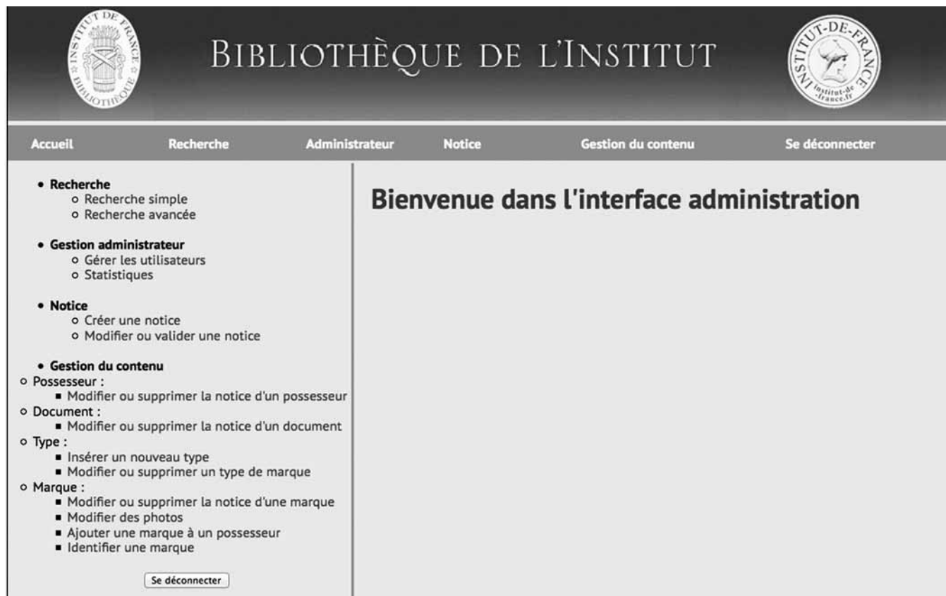
Photo 2. Interface Administration