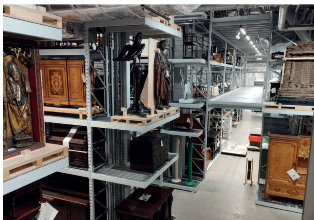
Obr. 1–13. Otevřené depozitáře, Victoria & Albert muzeum Londýn, foto Šárka Rámišová

Nový depozitář plánovalo Victoria & Albert muzeum zbudovat posledních deset let. Kapacity stávajícího depozitárního objektu v Blythe House byly již dlouhou dobu nedostačující a nenabízely budoucí rozrůstání sbírek. Navrhovaný projekt měl ambiciózní plány. Finanční náklady na zřízení nového depozitáře sice nebyly zveřejněny, ale odhady se pohybují od 64 do