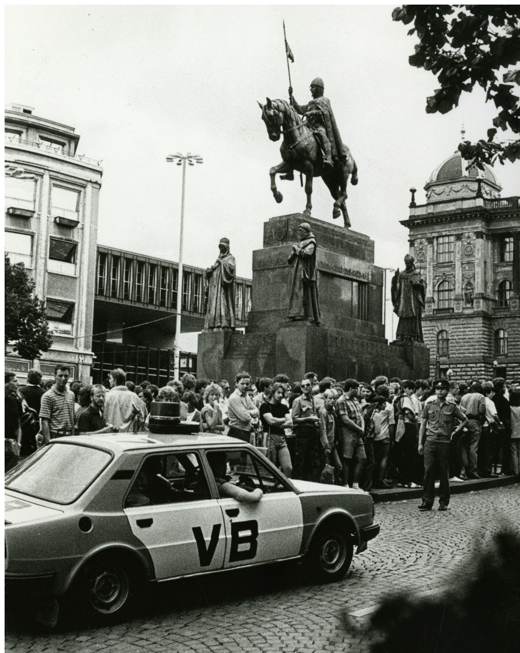
Demonstrace ke 20. výročí srpnové okupace, 21. 8. 1988 v Praze.

týkaly i čistě nepolitických aktivit ze světa hudby, umění, kultury. Zejména od roku 1972 pociťovali ostrý kurs režimu i návštěvníci alternativních koncertů. Oním mezinárodním přelomem a jedním z impulsů byl jistě protokol Organizace pro bezpečnost a spolupráci v Evropě z Helsinek z 1. srpna 1975. Na jedné straně byl některými uvnitř komunistického bloku