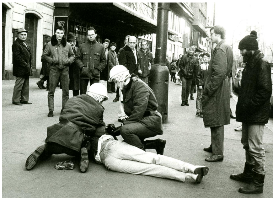
Demonstrace a perzekuce z Palachova týdne, leden 1989.

vnitřní posilnění Husákova režimu, což se nejen v souvislosti s Chartou 77 projevilo na konci této dekády skutečně tvrdými zásahy Státní bezpečnosti a justice vůči čemukoliv, co by mohlo představovat odlišný názor. Výbor na obranu nespravedlivě stíhaných je v rámci své agendy dobrým dokladem masovosti zásahů proti do té doby mnohdy politicky neaktivním lidem, kteří si jen dovolili vyslovit svůj názor. I to je možná mírný vykřičník pro naše vnímání té doby. Žijeme v obrázcích víkendových chalup, tuzemských dovolených, trapných prvomájových oslav a front na nedostatkové zboží. Mnohem méně vnímáme soukolí diktatury, která i v tomto období neomylně pronásleduje vše, co se jen trochu vymyká.