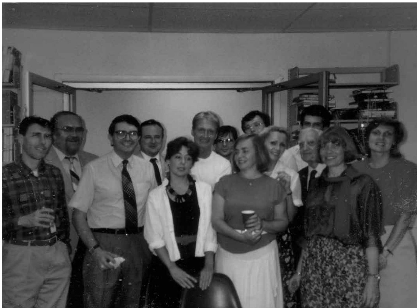
Československá redakce VOA v roce 1989.