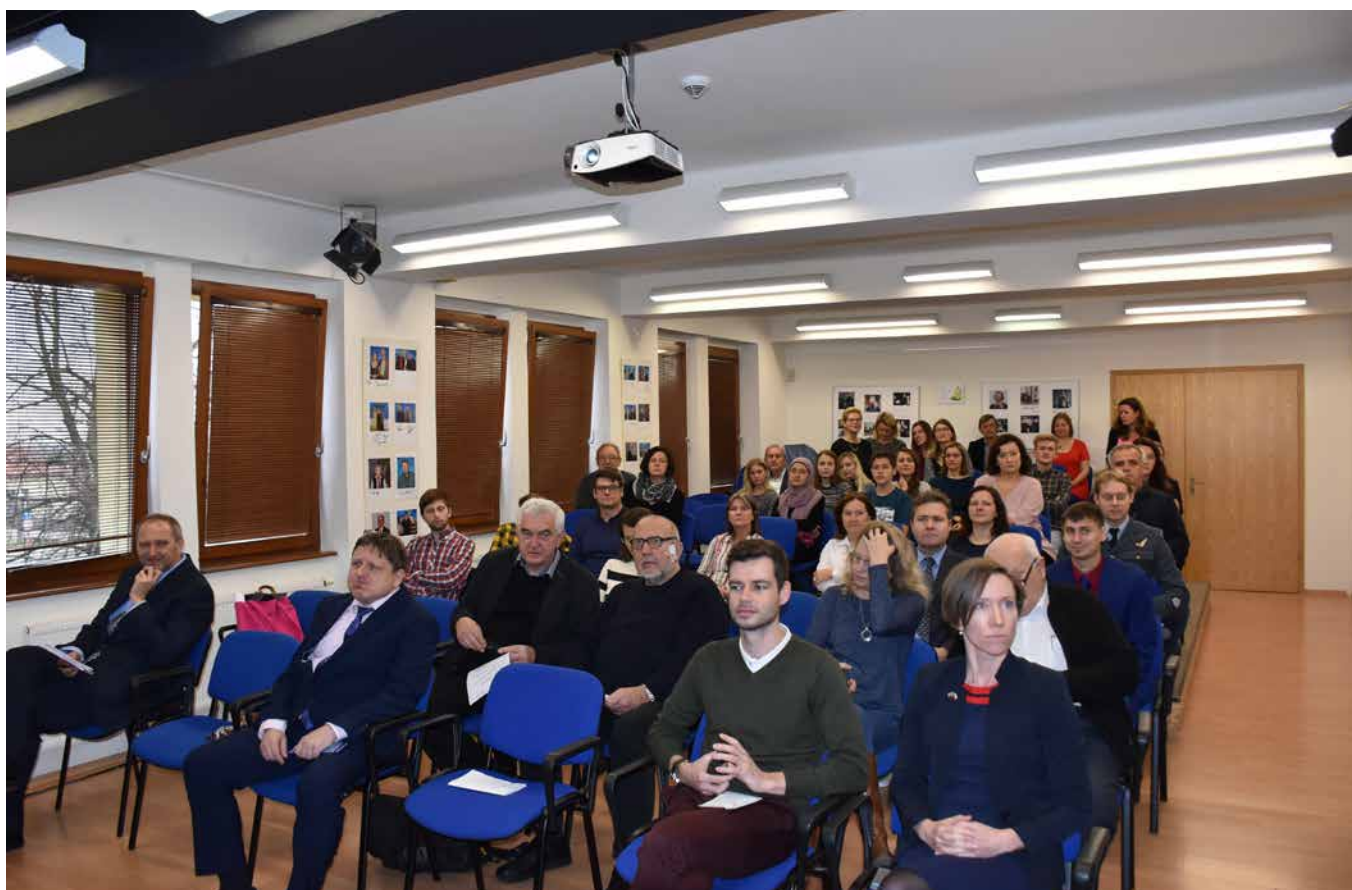
Obr. 3. Pohled na sál s návštěvníky konference