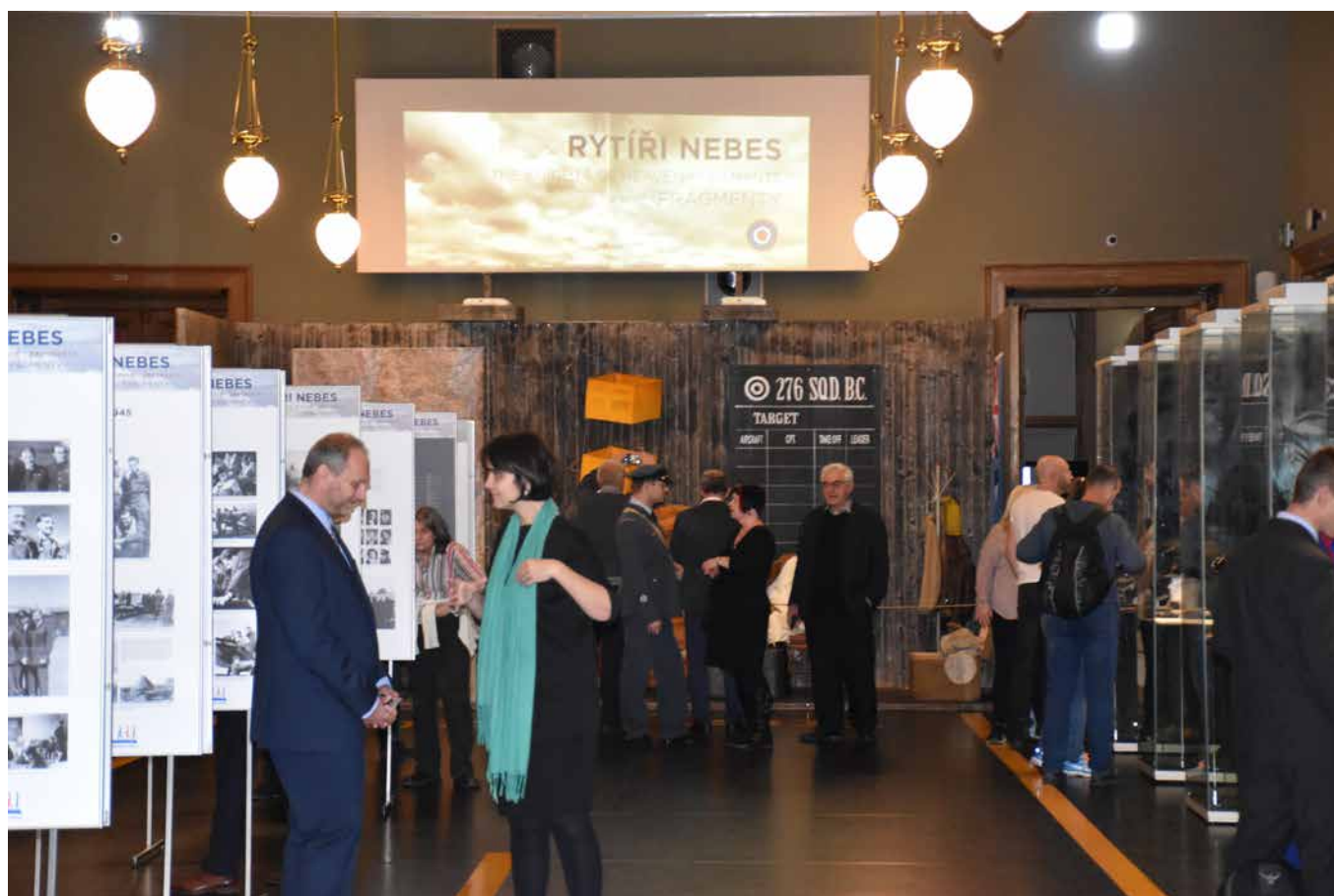
Obr. 7. Účastníci konference v Národním muzeu při prohlídce výstavy Rytíři nebes