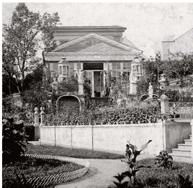
Obr. 8. Fotografie Landfrasovy zahrady. Jindřichův Hradec, Sběrka Muzea Jindřichohradecka, fond Fotografie, sig. Fo2615.