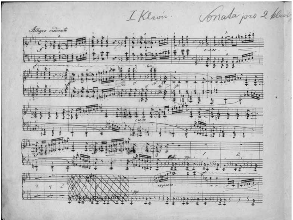
Bedřich Smetana: Sonáta Es dur pro dva klavíry , autograf (Piano 1) / Sonate in E flat Major for two Pianos , autograph (Piano 1) NM-ČMH-MBS S 217/1385

• Ball-Vision. Polka-Rhapsodie , dedicated to his Swedish friend Fröjda Benecke, who had supposedly inspired Smetana to compose the piece (the motif with the notes F-E-D-A is a hidden reference to her name).