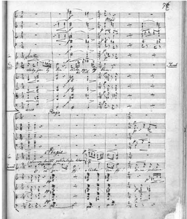
Bedřich Smetana: Braniboři v Čechách / The Brandenburgers in Bohemia