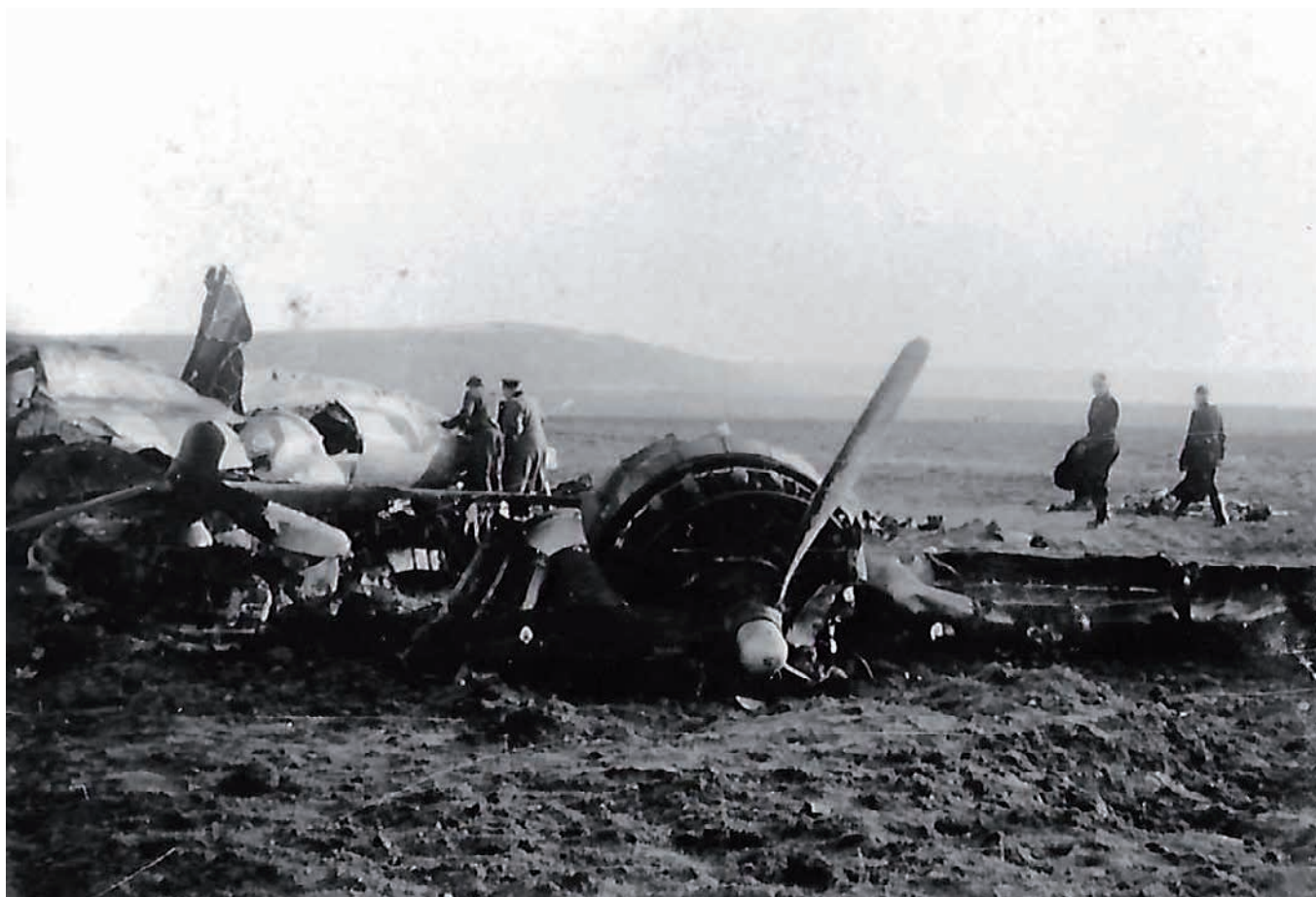
Obr. 5. Na místo zříceného bombardéru vzápětí dorazilo německé vojsko, následované českými četníky ze Slaného