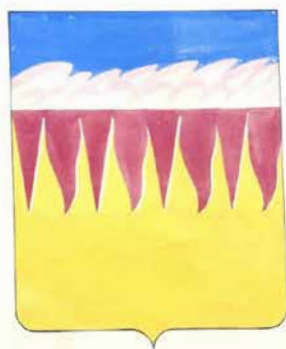
398. Bomb Group