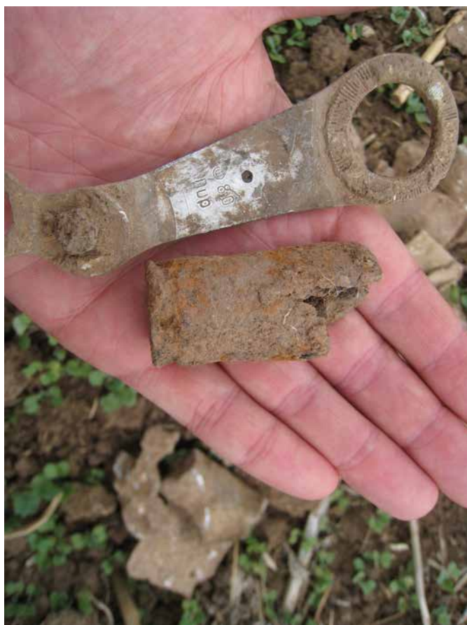
Obr. 8–9. Na poli u Třebíže lze dosud najít drobné kovové úlomky po dopadu stroje Focke-Wulf FW 190D-9, jasně identifikovat jde zkorodované plechové nábojnice pro palubní kanón MG 151/20 nebo táhlo řízení s vyraženým kódem výroby „Dup“.