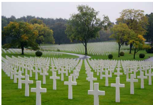
Obr. 10. Lorraine American Cemetery and Memorial, St. Avold, Francie. Po exhumaci ve Slaném byla těla 8 amerických letců pohřbena právě zde. Později, obvykle na žádost rodiny, bylo sedm letců převezeno k pohřbu do USA