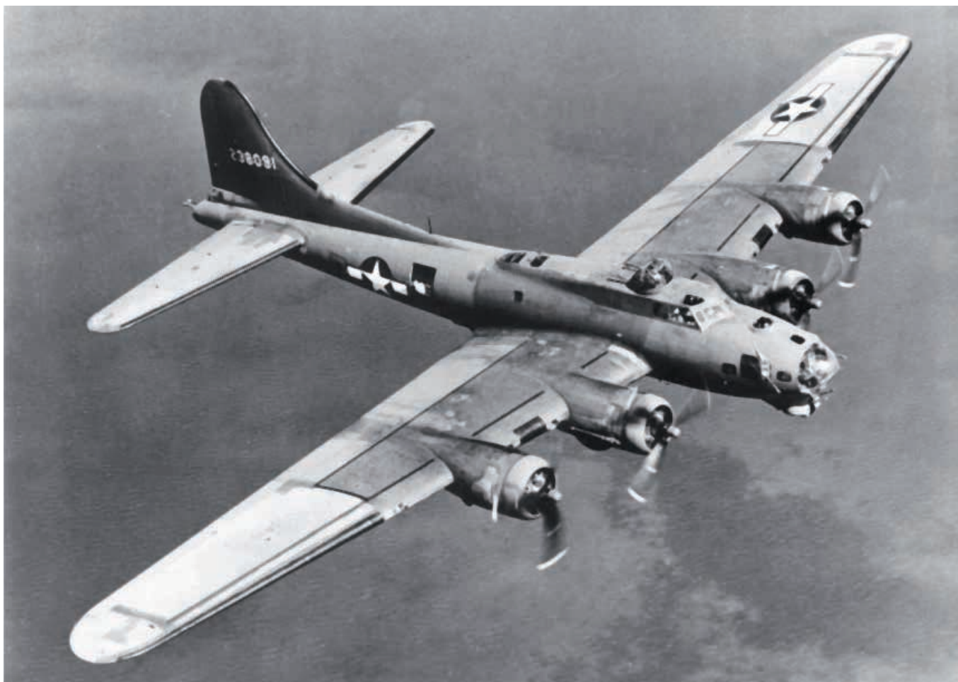
Obr. 2. Těžký bombardér Boeing B-17 Flying Fortress. 19

velitelství v Praze nově uvádí, že z trupu zříceného amerického bombardéru bylo vyproštěno 7 těl, a rovněž, že dva letci vyskočili na padáku, jeden byl zadržen v Brandýsku, druhého silný vítr odnesl nad okres Praha-venkov-sever. 17