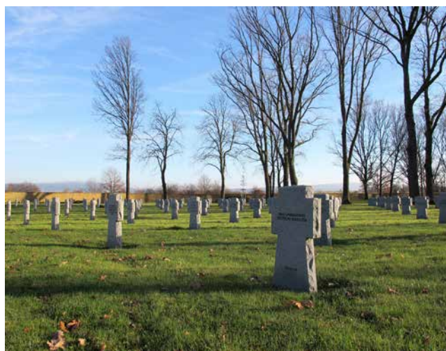
Obř. 12. Kriegsgräberstätte, Cheb. Údaje o pohřbu obou německých letců se nepodařilo dohledat, patrně byli pohřbeni na německý posádkový hřbitov v Praze-Štěrboholicích a po jeho částečné exhumaci v roce 1991 přeneseni na nově budovanou Kriegsgräberstätte v Chebu