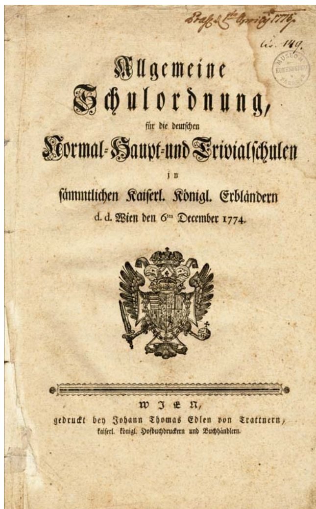
Obr. 1. Titulní strana Všeobecného školního řádu, kterým byla v roce 1774 provedena zásadní reforma základního vzdělávání. Muzeum Komenského v Přerově, fond Archiválie, písemnosti a dokumentace dějin školství a kmeniologie.

se z těchto knihoven odstranily nejen všechny škodlivé a zhoubné, ale i bezúčelné a nevhodné knihy, 5 nařizuje c. k. dvorská studijní komise dekretem z 12. července t. r., dvor. čís. 3473, přesně dbát následujících opatření...“