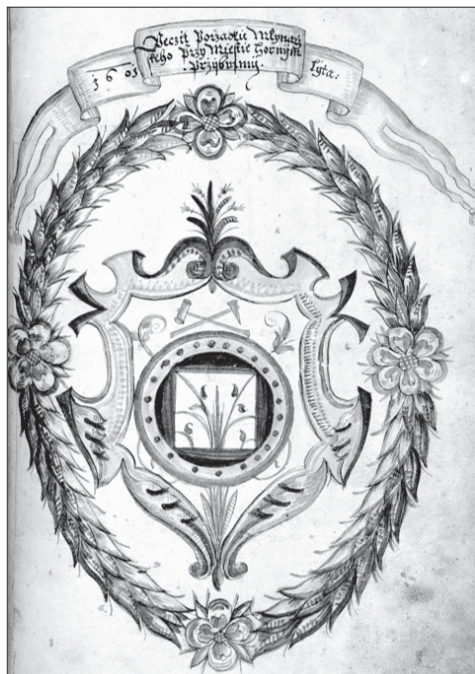
Obrázek 1 – Znak cechu přibramských mlynářů z cechovní knihy, 1601. Státní okresní archiv Přibram.

Litavka se v Berouně vlévá do Berounky. Po většinu roku je spíše potokem, který se ovšem při častých povodních dokáže řádně rozlítit, jak už vypovídá i její jméno. V některých měsících nebo letech naopak bývalo vody málo, a protože šlo o vodu nestálou, musela být nad každým mlýnem vybudována nádržka. I tak vzhledem k neuvěřitelně vysokému počtu vodních kol na vrchní vodu, která na Litavce v tomto regionu byla umístěna, docházelo o vodu mezi mlynáři a horním závodem k častým sporům. 4