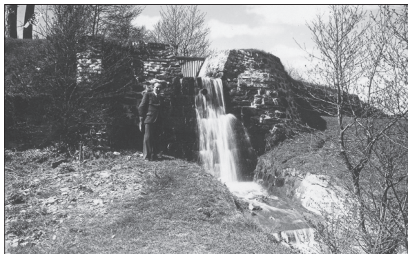
Obrázek 2 – Mlýniště Kocourova mlýna, 1945