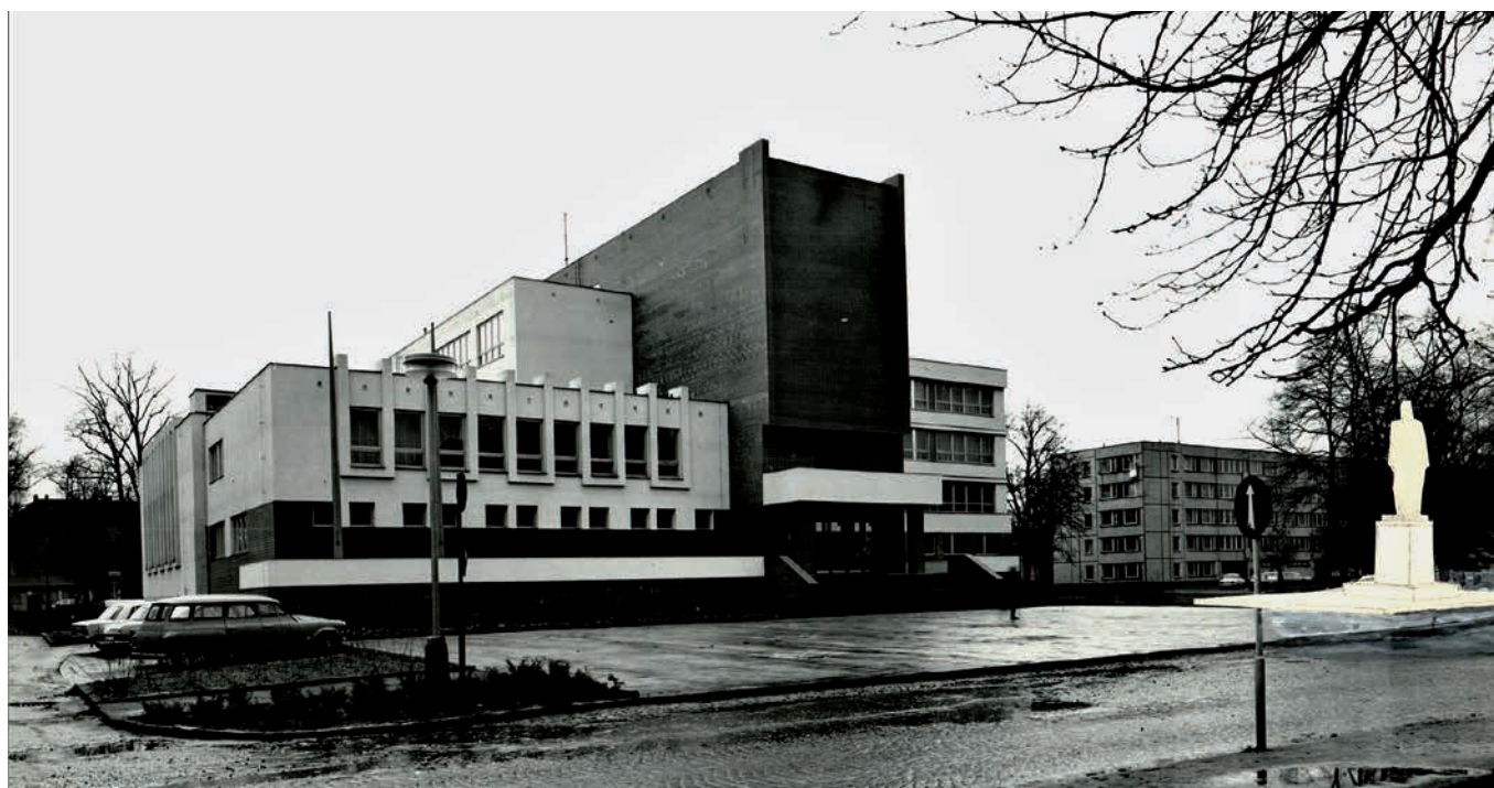
Obr. 14. Situační zakreslení makety před budovou OV KSČ v Rakovníku.

Za posledním dokončeným středočeským pomníkem se vrátíme zpět do Polabí, kde sice již v roce 1983 svůj projekt dotáhly do konce agilní Pečky, ale příslušné okresní město