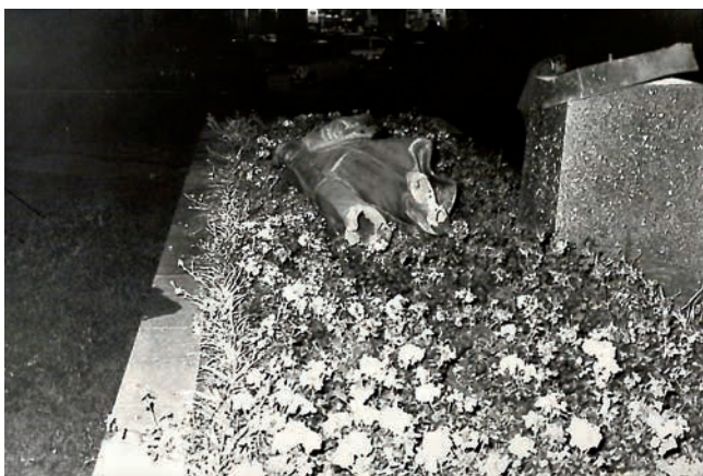
Obr. 3. Socha odstřelená z podstavce v srpnu 1978.