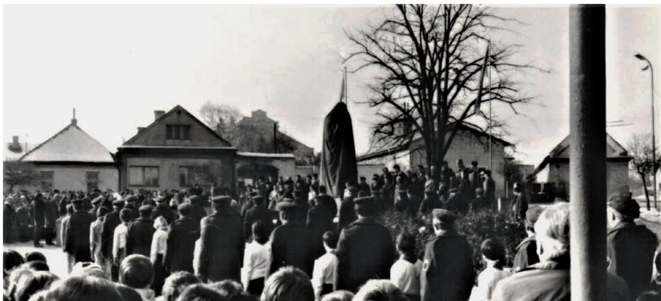
Obr. 12. Slavnostní odhalení v Pečkách dne 25. 2. 1983.