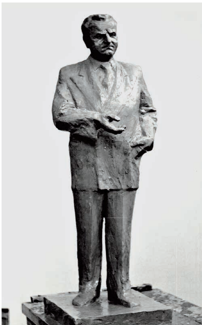
Obr. 19. Dílčí model Gottwaldovy sochy od V. Fridricha.

Slavnostní odhalení pomníku proběhlo nakonec až 4. května 1985, tedy zhruba deset let za počátečním očekáváním zřizovatelů. Hlavním hostem byl člen předsednictva ÚV KSČ a předseda Ústřední rady odborů Karel Hoffman. Bronzový Gottwald na svém místě zůstal až do 6. ledna 1990, kdy byl přesunut do skladu. Od poloviny devadesátých let pak socha dočasně (v letech 1994–2001 a 2004–2006) za symbolickou korunu ročně vytvářela kulisu u restaurace v obci Zbožíčko, kde jí dělal společnost někdejší Leninův pomník z Mladé Boleslavi. 80 V současné době je plastika opět uložena v městském depozitáři.