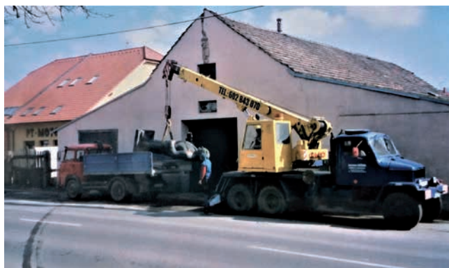
Obr. 21. Jedno ze stěhování sochy v polistopadovém období.