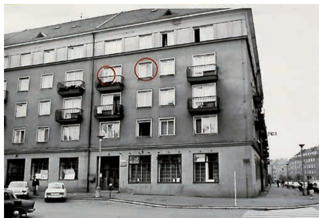
Obr. 4. Okna poškozená výbuchem.