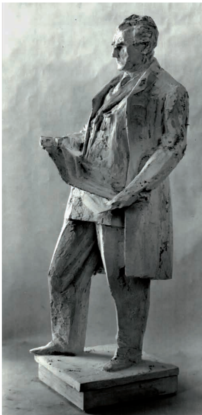
Obr. 10. Dílčí model Gottwaldovy sochy od R. Svobody.

okresního výboru (OV) KSČ 50 se nacházela mezi Rakovnickým potokem a ulicí Na Sekyře (v těsném sousedství parku, který v dotyčné době nesl název Gottwaldovy sady) a vzniklé prostranství zlákalo místní funkcionáře k úvahám nad zřízením monumentální sochy. 51 Bylo sice v celku nasnadě, komu by měl být pomník věnován, ale nabízely se i jiné