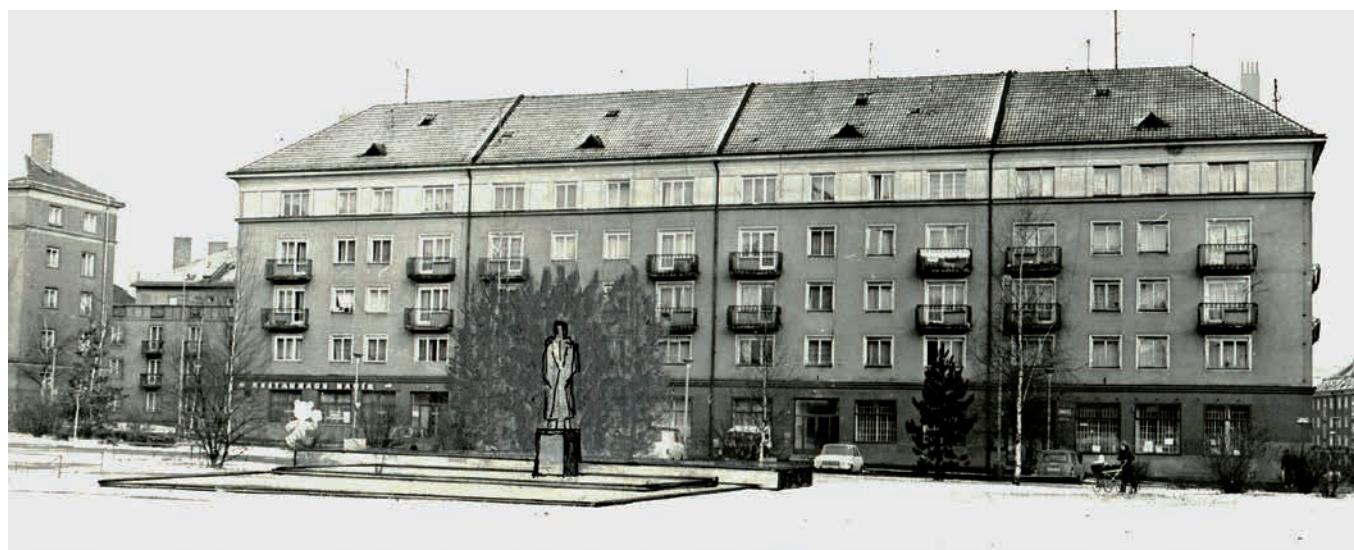
Obr. 1. Situační zakreslení makety na náměstí VŘSR v Příbrami.

Figurální pomníky věnované prvnímu dělnickému prezidentovi se v Československu začaly objevovat až po jeho skonu v roce 1953, zpočátku především na rodné Moravě. 7 S postupem šedesátých let pak instalace Gottwaldových pomníků načas prakticky ustávají, což bylo logické vzhledem k nárůstu kritických ohlédnutí právě za obdobím Gottwaldova prezidentství. Ideologické přešlapování kolem Gottwaldova odkazu je třeba dát do souvislosti především s XX. a XXII. sjezdem Komunistické strany Sovětského svazu (KSSS), přičemž zde proklamovaná destalinizace ohrožovala i s ní těsně provázaný Gottwaldův kult. V návaznosti na odstranění Stalinovy mumie z mauzolea na Rudém náměstí bylo ostatně bez velkých ceremonií v červnu 1962 zpopelněno i dosud pečlivě udržované Gottwaldovo tělo. 8 Výrazný vzestup počtu Gottwaldových monumentů pak můžeme zaznamenat teprve v sedmdesátých a osmdesátých letech, kdy normalizační režim podobnými instalacemi manifestoval nejen celou svou poválečnou legitimitu, ale i bezpečně ovládnutí veřejného prostoru po „zmatcích“ let 1968 a 1969. Například Praha svůj kamenný hold uskutečnila v roce 1973. 9