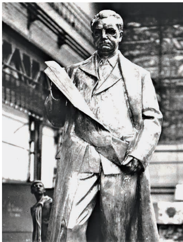
Obr. 11. Bronzový odlitek pečeckého pomníku ve slévárně.

okresního výboru (OV) KSČ 50 se nacházela mezi Rakovnickým potokem a ulicí Na Sekyře (v těsném sousedství parku, který v dotyčné době nesl název Gottwaldovy sady) a vzniklé prostranství zlákalo místní funkcionáře k úvahám nad zřízením monumentální sochy. 51 Bylo sice v celku nasnadě, komu by měl být pomník věnován, ale nabízely se i jiné