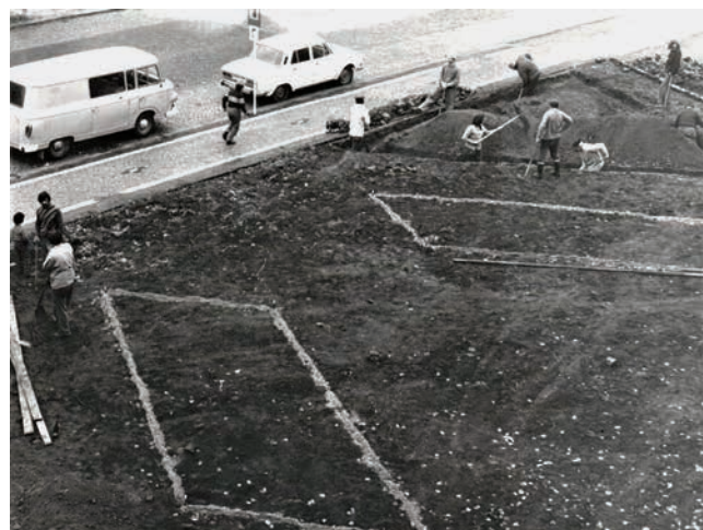
Obr. 7. Kopání základů pro pečecký Gottwaldův pomník.

Původní plán vybudovat v Pečkách pomník Klementu Gottwaldovi vznikl dle dostupných pramenů 33 již během roku 1969 v městském zastupitelstvu za předsednictví