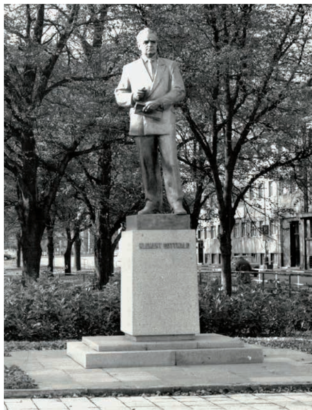
Obr. 16. Gottwaldův pomník v Rakovníku – celkový pohled.

na odhalení Gottwaldovy sochy stále čekalo. Prvotní úvahy o zbudování lze přitom vystopovat už do roku 1971, kdy 16. září rada MěNV rozhodla o zahájení jednání v této věci a termín dokončení byl poměrně realisticky stanoven na podzim 1976 do období nedožitých osmdesátin někdejšího prezidenta. 69 V následujících měsících se nymburští zastupitelé postupně obraceli na různá místa s žádostí o pokyny a součinnost. Ministerstvo kultury odpovědělo dopisem z 24. ledna 1972 v tom smyslu, že vzhledem k významu stavby by místo použití kopie bylo vhodnější vypsání umělecké soutěže, přičemž byla zdůrazněna časová náročnost tohoto postupu. Ideová rada se příslušným podáním zabývala na svém zasedání dne 12. září 1972 a tazatelům doporučila v podstatě totéž. 70 V rámci sbírání informací se zkoumaly také postupy jiných měst realizujících obdobné projekty – z Nymburka odešla v prosinci 1972 žádost o pomoc do Hradce Králové, kde místní funkcionáři právě chystali odhalení Gottwaldova pomníku k čtvrtstoletí od únorových událostí. 71 Královéhradečtí svým nymburským kolegům