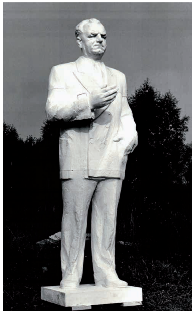
Obr. 20. Definitivní sádrový model budoucího nymburského pomníku. Zdroj: NA, f. MK ČSR/ČR, sign. 30 Nymburk – IR, kart. 231, nezprac.

Na předestřených osudech čtyř středočeských pomníků Klementa Gottwalda můžeme přes různost dílčích okolností vysledovat několik zajímavých obecných postřehů. Přestože všichni zřizovatelé svůj záměr koncipovali ještě hluboko v 70. letech (Pečky dokonce ještě dříve), do konce příslušné dekády se podařilo realizovat pouze příbramský projekt, a to především díky výjimce povolující užití kopie již existujícího díla. Ostatní tři města sice chtěla zvolit obdobný