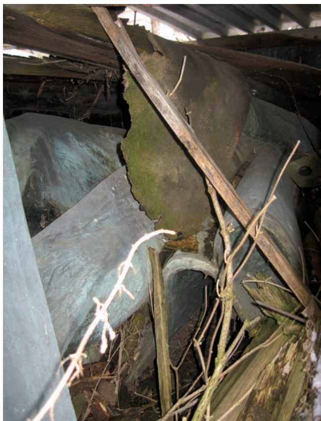
Obr. 13. Gottwaldova socha od R. Svobody – stav v roce 2017.

(22. 12. 1989) došlo demontáži pomníku pomocí autojeřábu. 64 Bronzový Gottwald byl následně převezen do depozi-táře tehdejšího Okresního muzea a galerie Rakovník (dnes Muzeum T. G. M.), kde byl uskladněn a čekal na další osud. Díky dochované předávací smlouvě mezi ONV a muzeem z 27. prosince 1989 můžeme vyčíslit i původní pořizovací hodnotu díla – 963 622,40 Kčs. 65