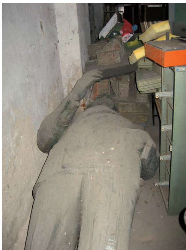
Obr. 22. Nymburská socha v roce 2017.

socha, a to ta příbramská. Současný narativ, který se k pomníku váže, tj. že byl dramatickým odbojným činem (dočasně) odstraněn z podstavce, z něj spoluvytváří svébytné „místo paměti“. Ostatní tři sochy tento potenciál zřejmě nemají, svou platnost dobových artefaktů by si však měly podržet a zůstat mementem pro generace budoucí.