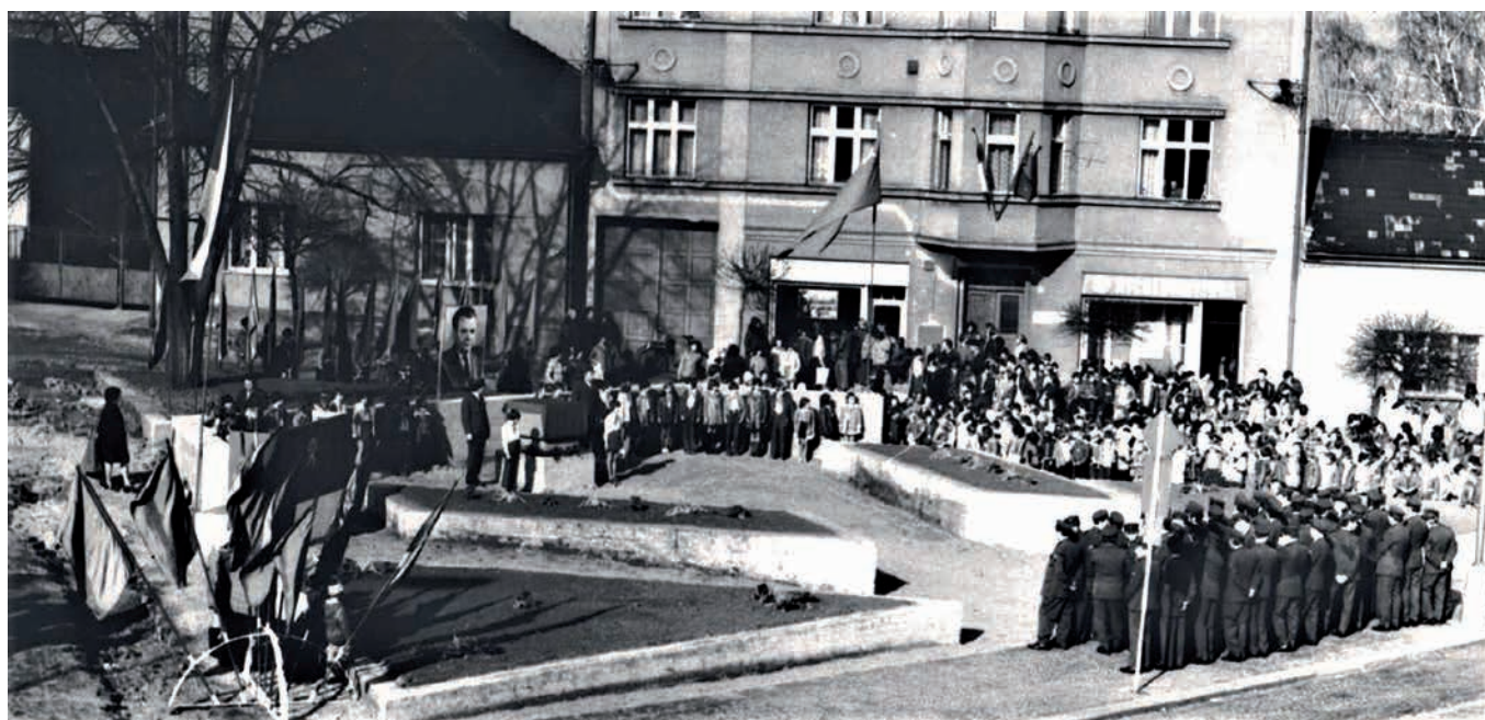
Obr. 8. Slavnostní položení základního kamene v Pečkách dne 24. 2. 1977.