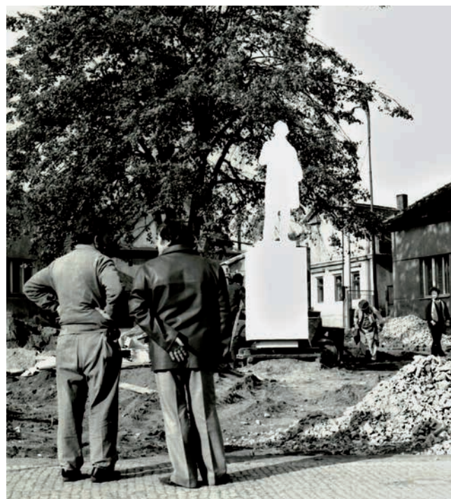
Obr. 9. Maketa budoucího pomníku v Pečkách.

Zatímco pozvolna vznikala definitivní předloha budoucího pomníku, v Pečkách přikročili alespoň ke slavnosti položení základního kamene, které proběhlo 24. února 1977. 45 Sochař Svoboda si skutečně dal načas, protože model ve velikosti 1 : 1 dokončoval až na přelomu let 1978 a 1979. Ideová rada ho pak posoudila v červnu 1979 a stále nepanovala všeobecná spokojenost. Rada se naopak ztotožnila s nedávným stanoviskem umělecké komise ČFVU, v němž byla socha zhodnocena mj. takto: „Umělecká komise je názoru, že stavba díla je v zásadě ukončena. UK dává připomínky k některým detailům plastiky /např. portrétní dotazování, modelace rukou, hmota v zádech, řezání [řešení?] faldů u kolene pravé nohy, některé proporční vztahy mezi pravou částí pánve a levou částí hrudníku. Rovněž, pokud jde o střední motiv /plány/ doporučuje jej UK více prostorově vystavět tak, aby působil vážněji, více se přiblížil ideové myšlence autora /budování – plánování/.“ 46 Pro tak zkušeného umělce 47 se to po několika letech práce zdá až příliš mnoho výhrad... Sochař po těchto připomínkách patrně začal s modelací znovu od začátku – jen tak lze totiž vysvětlit fakt, že Ideová rada schválila dílo k odlití do bronzu až za další tři roky (18. května 1982). 48