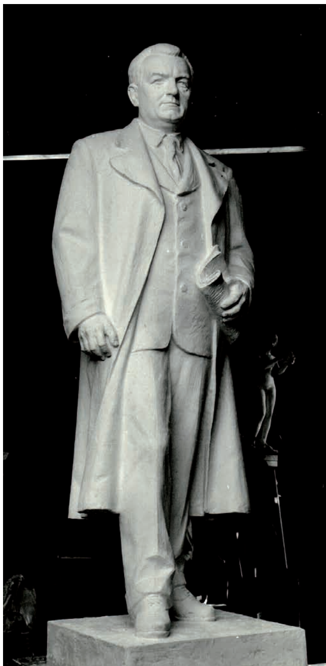
Obr. 2. Hotový sádrový model příbramského pomníku. Zdroj: NA, f. MK ČSR/ČR, sign. 30 Příbram – IR, kart. 198, nezprac.

Dalším ideologicky významným datem, které režimní propaganda nemohla v žádném případě ignorovat, byl rok 1975, kdy hlavní stranické festivity směřovaly k připomínce třicátého výročí osvobození a po desetileté pauze se připravovala i další spartakiáda. A právě do tohoto období chtěli tehdejší příbramské činovníci ukotvit projekt stavby Gottwaldova pomníku. Původní námět vzešel již na počátku roku 1974 z řad funkcionářů Městského národního výboru (MěNV) a městského výboru (MV) Komunistické strany Československa (KSČ) v Příbrami a postupně přes okresní a krajskou úroveň doputoval až na zasedání předsednictva ústředního výboru (ÚV) KSČ, kde byl 20. září 1974 schválen. 14 Tato byrokratická těžkopádnost však dostala celý projekt už od samého počátku do časového presu. I zde se potvrdilo, že realizace podobných monumentů sice patřily mezi stavby protežované, ale zároveň stranickými orgány bedlivě sledované, což v konečném důsledku vše jen zbrzdilo. 15