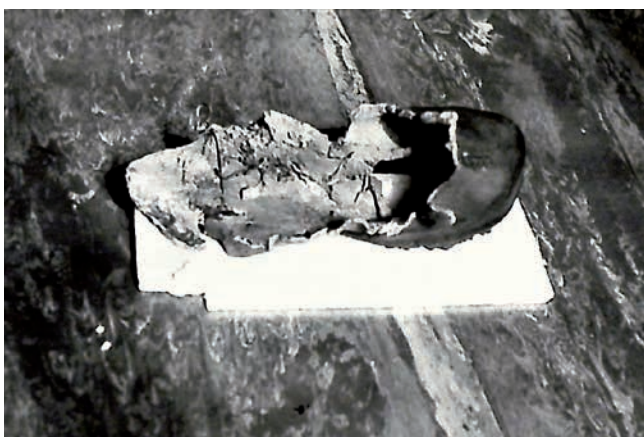
Obr. 5. Zbytek pravé boty z Gottwaldova pomníku.