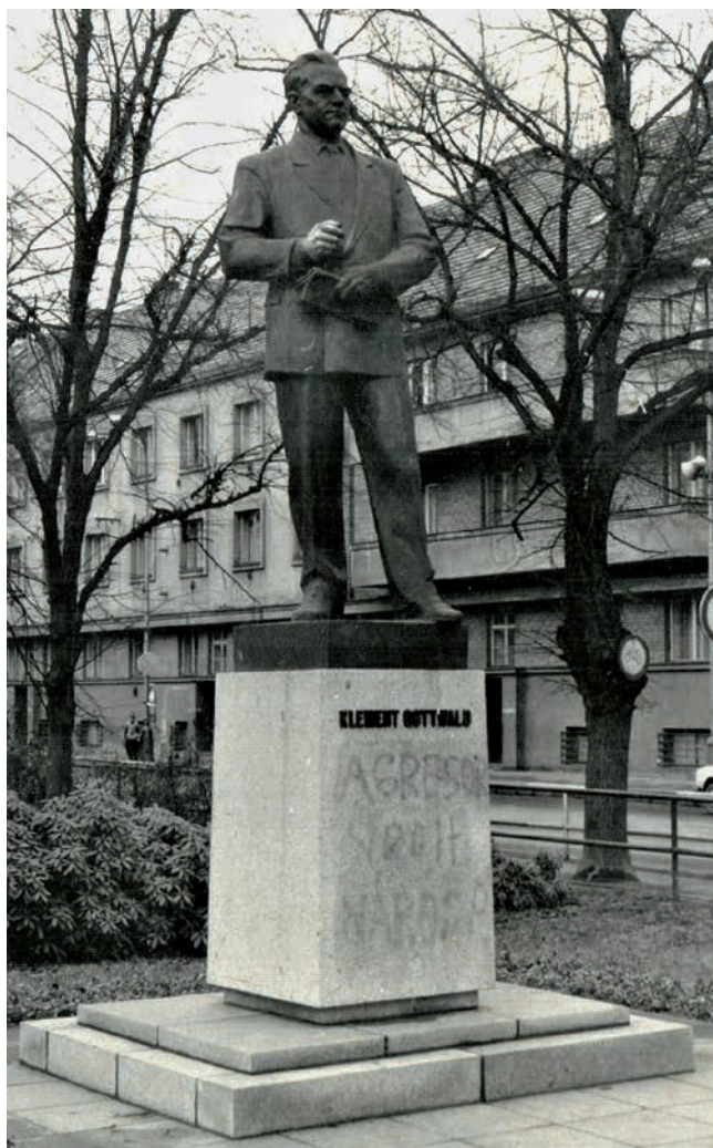
Obr. 17. Během sametové revoluce byla socha popsána slovy „Agresor“ a „Vrah národa“.

nymburský městský architekt. Středočeští zřizovatelé se domnívali, že značná vzdálenost mezi oběma městy zajistí bezproblémové schválení kopie, ale z tohoto omylu byli vyvedeni 2. prosince 1975 po jednání Ideové rady, která navržený postup odmítla. 75 Vše se tak vrátilo prakticky na začátek a zpoždění narůstalo.