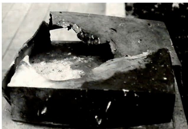
Obr. 6. Plintus vážně poškozený výbuchem.

vyčíslen na 820 tisíc Kčs, přičemž samotná socha si měla vyžádat zhruba půl milionu. Ideová rada celou záležitost projednala na svém zasedání dne 4. března 1975, příbramský návrh nepřijala a své stanovisko pak 8. dubna zaslala předkladatelům. Konečné rozhodnutí rada nicméně přenechala až stranickým orgánům, konkrétně předsednictvu ÚV KSČ.