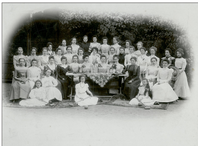
Obrázek 4 – První žákyně Prvního dívčího penzionátu pro dívky v Praze s krocketovými paličkami. Foto Jan Mulač, 1898. Sbírkové odd. NpM, sg. K 49.