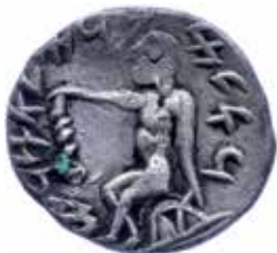
●□ 1: Barbarizovaný reverz tetradrachmy z územia Sogdiany, napodobujúci mincu baktrijského panovníka Euthydemosa I. Podľa Katz Auction 16, pol. 1553.

Z viacerých príkladov je zrejmé, že myšlienkovú a ikonografickú inšpiráciu nenachádzalo v antickom mincovníctve iba keltské etnikum, ale i niektoré iné barbarické národy, ovplyvované mytológiou a kultúrou helénskej civilizácie. Príkladné paralely barbarizovaného stvárnenia sediacej postavy ponúkajú napr. tetradrachmy z územia starovekej Sogdiany, imitujúce na reverze mince baktrijského panovníka Euthydemosa I. (220–186 pred Kr.), s Herkulom sediacim na skale. Rázenie takto barbarizovaných tetradrachmiem s aramejskou legendou je datované do rokov 180–130 pred Kr. 4 (obr. 1).