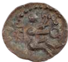
●□ 2: Reverz obolu so sediacou postavou (druida?). Podľa FRÖHLICH, J.: Keltské mince , s. 66, tab. II/8.

Ikonografický motív sediacej postavy je v stredoeurópskom keltskom mincovníctve ojedinelým príkladom, ktorý si zachoval obrazovú kontinuitu i v mladšom období, v dobe existencie oppíd. Dokumentuje to keltský obol so sediacou postavou na reverze, produkovaný v mladolaténskom stupni LT D (obr. 2). Je známy zo slovenského oppida Pohanská v Plaveckom Podhradí, z rakúskych lokalít Dröising a Roseldorf i z oppida Tisov v Čechách. 5