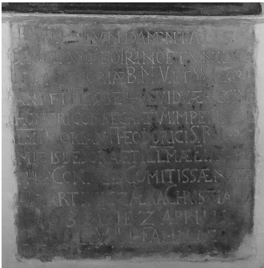
● □ 1: Základní kámen kaple sv. Floriána z roku 1630.

Transkripce textu: Lapis fundamentalis. Sacellum Deo Trino et unidicatum Memoriae Beatæ Mariæ Virginis et Sanctissimorum Floriani et Elisabethæ viduæ Reginae honori consecratum impensis Illustrissimi Floriani Theodorici Sacri Romani Imperii Comitissæ de Sora et Illustrissimæ Elisabethæ coniugis Comitissæ natae a Martinicz. Aera Christiana 1630. Die 2. Aprilis P.F.D.E.V.H. Familiae.