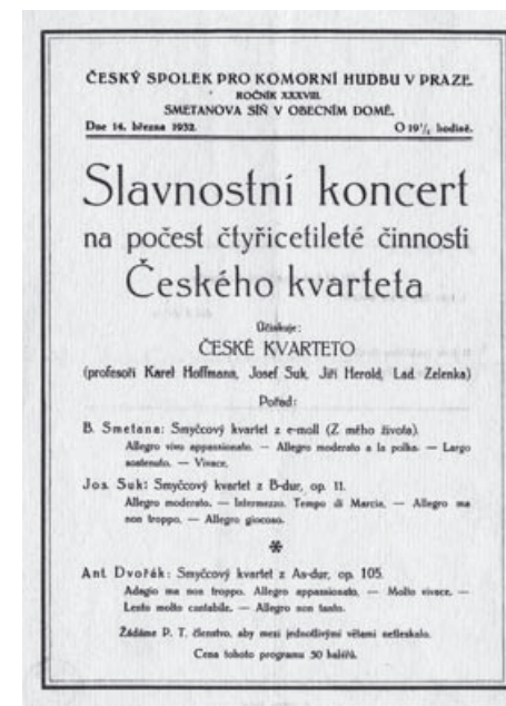
Program koncertu Českého kvarteta ke čtyřicetiletému výročí souboru, Praha 14. 3. 1932 / Program for the Czech Quartet concert on the occasion of the 40th foundation of the ensemble, Prague March 14, 1932 NM-ČMH, č. př. / Acquisition No. 24/1985