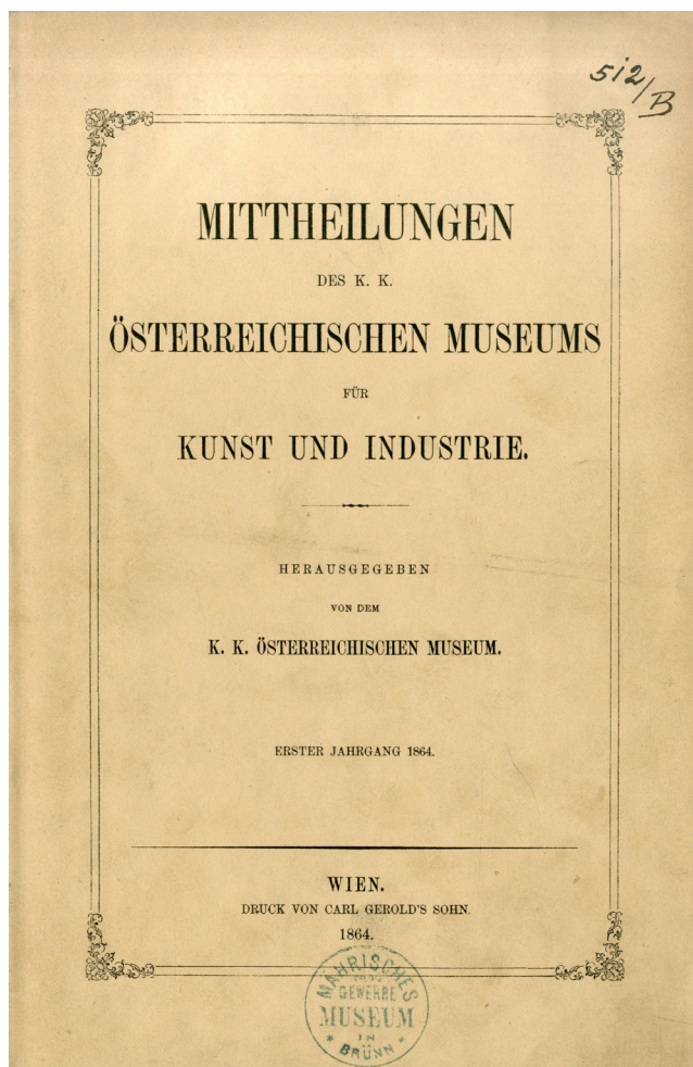
Obr. 1. Obálka časopisu Mittheilungen des k. k. Österreichischen Museums für Kunst und Industrie . Erster Jahrgang 1864.

První uměleckoprůmyslové muzeum – South Kensington Museum, později Victoria and Albert Museum – bylo založeno v roce 1852 v Londýně a mělo významný vliv na rozvoj uměleckého průmyslu v Anglii v druhé polovině 19. století. 6 Činnost muzea byla každoročně podchycena ve výročních zprávách.