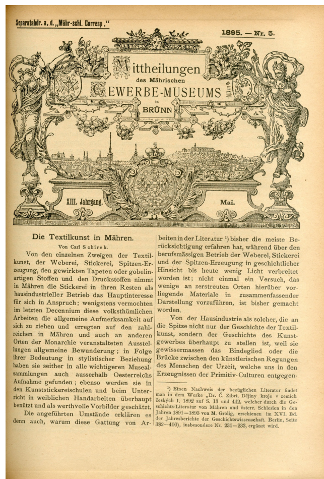
Obr. 6. Titulní strana Mittheilungen des Mährischen Gewerbe-Museums in Brünn , 1895, Nr. 5 s vedutou Brna.

Důkladnou pozornost věnoval i muzejnímu časopisu, který byl od roku 1896 do roku 1904 vydáván dvakrát do měsíce. Leisching rozdělil obsah na pět oddílů, z nichž úvodní část zahrnovala umělekohistorické studie, následoval oddíl s informacemi o výstavách, přednáškách, konferencích, darech. Nedílnou součástí byly zprávy kuratoria