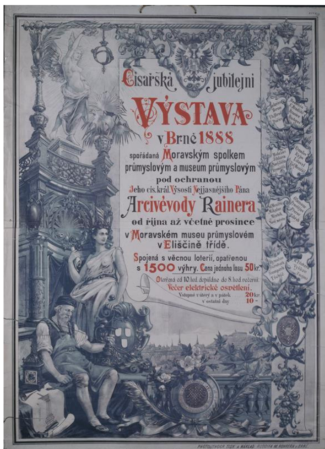
Obr. 5. Plakát Císařské jubilejní výstavy v Moravském průmyslovém muzeu roku 1888, 120 × 90 cm, česká verze.

čísla časopisu s detailními informacemi o organizaci a programu této významné události. Na obálce prvního až třetího čísla roku 1889 byl potom použit plakát výstavy a v prvním čísle tohoto ročníku byl otištěn seznam oceněných vystavovatelů. Od roku 1888 byl časopis tištěn ve významném nakladatelství a tiskárně rakouského podnikatele a poslance Moravského zemského sněmu Rudolfa M. Rohrera (1838–1914). Na konci osmdesátých let se v časopise objevovaly odborné studie o světovém výtvarném umění a uměleckém řemesle a nedílnou součástí byly podrobné výroční zprávy za předchozí rok, které byly tištěny samostatně.