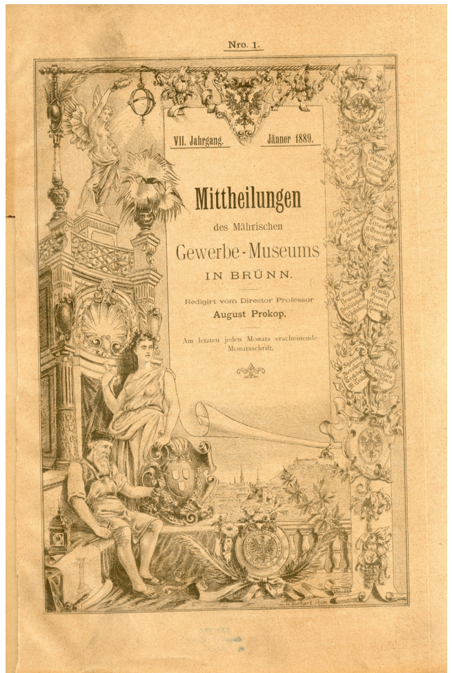
Obr. 4. Obálka Mittheilungen des Mährischen Gewerbe-Museums in Brünn , VII. Jahrgang 1889, Nr. 1. Na obálce byl použit plakát Císařské jubilejní výstavy z roku 1888 uspořádané v Moravském průmyslovém muzeu v Brně.

Vlastní časopis začalo muzeum vydávat v roce 1883 za ředitele prof. Augusta Prokopa (1838–1915), později profesora na Vysoké škole technické ve Vídni. Časopis vyšel v nákladu 1 400 výtisků 10 v podniku brněnského tiskaře a vydavatele Wilhelma A. Burkhardta (1805–1867). Vycházel až do roku 1885 jako periodická jednolistová příloha k Mährisch-schlesischer Correspondent , od roku 1886 některá čísla také jako příloha k Mährisches Gewerbeblatt , a to jednou týdně. Zpočátku obsahoval jednu úvodní monogramatickou studii, krátké zprávy z oboru a seznam odborné literatury.