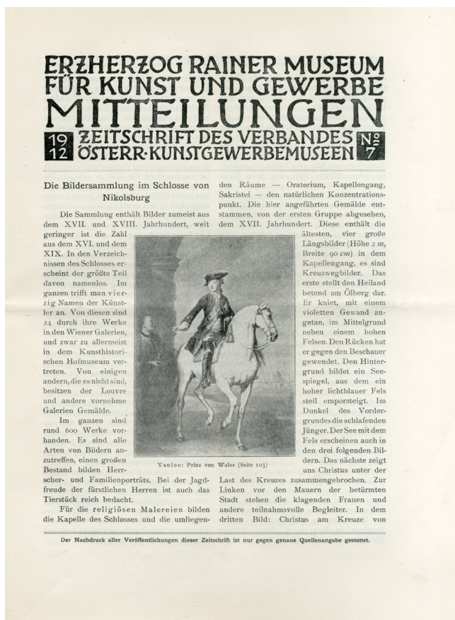
Obr. 8. Titulní strana Mitteilungen des Erzherzog Rainer Museum für Kunst und Gewerbe. Zeitschrift des Verbandes Österr. Kunstgewerbemuseen , 1912, Nr. 7.

Obsahoval studie, zprávy a informace zaměřené nejen na umělecký průmysl, ale i na oblast volného umění a památkové péče na Moravě a na území rakouské monarchie. Stal se tak významným kulturněhistorickým pramenem pro tuto problematiku v období konce 19. a začátku 20. století. Ve srovnání s jeho vídeňským vzorem Mittheilungen des k. k. Oesterreichischen Museums für Kunst und Industrie byl doplněn bohatými obrazovými přílohami a měl výraznější grafickou úpravu, podobně jako časopis libereckého muzea Mittheilungen des Nordböhmisches Gewerbe-museums , který vycházel ve stejném období. Na počátku 20. století se stal díky muzeologickým aktivitám ředitele Julia Leischinga tiskovým orgánem Svazu rakouských uměleckoprůmyslových muzeí, Svazu rakousko-moravských místních muzeí a Německo-moravského svazu památkové péče.