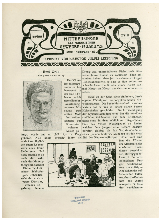
Obr. 7. Titulní strana Mittheilungen des Mährischen Gewerbe-Museums in Brünn , 1900, Februar, Nr. 3 se secesním ornamentem.

Kompletní ročníky časopisu sloužily několika generacím odborníků a studentů a častou manipulací docházelo k jeho