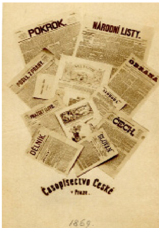
Obrázek 4 – Jediná fotografie v albu, která nezpodobňuje osobnost, ale významný dobový fenomén – periodický tisk.

Naše poznání vztahující se se k výše zmiňovanému albu je doposud limitované a některé záležitosti k němu se vzájemně pravděpodobně nebudou zcela zodpovězeny asi nikdy. Samotné album nám o svém vzniku mnoho nevyovídá a ani komplementární prameny obsažené v osobním fondu Bohuslava Duška se k němu nijak blíže nevyjadřují, pouze za-