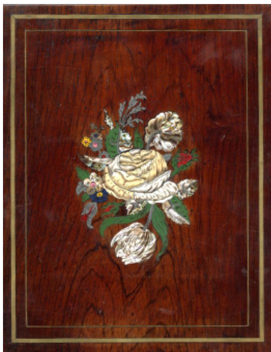
Obrázek 1 – Přední deska fotografického alba ze sbírek Bohuslava Duška zdobena vykládaním v podobě kytice.

Fotografické album jako artefakt hrálo v dějinách fotografie velice důležitou a často dosud i podceňovanou roli. Vzestup jeho užití úzce souvisel se zásadními změnami v technologii fotografického procesu, kdy finančně nákladnou a rovněž i zdoluhavě vytvářenou daguerrotypii (nutně adjustova-