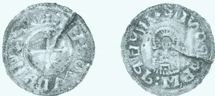
• Obr. 1. ČECHY, Jaromír (1004–1012), denár (obol) C 262 ze sbírek petrohradské Ermitáže

V souvislosti s přípravou obrazových podkladů pro studii o dosud neznámém typu denáru knížete Oldřicha 1 se mi podařilo z petrohradské Ermitáže získat fotografie denáru knížete Jaromíra typu Cach 262 2 (dále jen C 262) známého do dnešních dnů pouze v jediném exempláři. Vzhledem k okolnosti, že byl dosud tento denár znám českým badatelům pouze z kreseb a z jediné nekvalitní fotografické reprodukce, dovoluji si zveřejnit fotografie lící i rubní strany tohoto denáru včetně popisu a krátké historie „života“ tohoto denáru v české a světové numismatické literatuře. 3