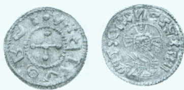
• Obr. 3. ČECHY, Jaromír (1004–1012), denár C 260/261 z nálezů žateckého (AR, ø 19 mm)

denáru knížete Jaromíra byzantizujícího typu z nálezů žateckého, který má Cach nepochybně na mysli, nás však přesvědčí o opaku (obr. 3). 9