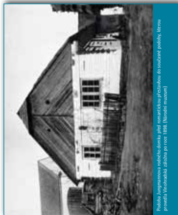
Podoba Jungmannova rodového domu, před rekonstrukcí a přestavbou do současné podoby, kterou provedla Vlnohradská zřizovna po roce 1988.

Rodný domek předního představitel národního obrození se brzy po Jungmannově smrti (†1847) stal uctivanou památkou. Již 15. července 1860 byla na něm slavnostně umístěna pamětní destička. Při této příležitosti byli vlastenci vyzváni k národní sbírce, jež by umožnila jeho zakoupení. Po třinácti letech, 20. července 1873, byl před objektem slavnostně odhalen litinový pomník s Jungmannovou bustou. Myšlenka na vykoupení domku ze soukromého vlastnictví ožila znovu v listopadu 1897 při padesátém výročí úmrtí Josefa Jungmanna. Uskutečněna byla již 1. března 1898 zásluhou Vlnohradské záložny, která stavení koupila od manželů Františka a Anny Ondráčkových za 2000 zlatých.