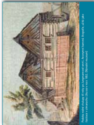
Podoba domku sdaliny tř. roky po Jungmannově smrti. Boromim barocni. Biografie, užlo, jako ilustrace v Almanachu Jihosask. Plošnice, v roce 1827. (Národní muzeum)