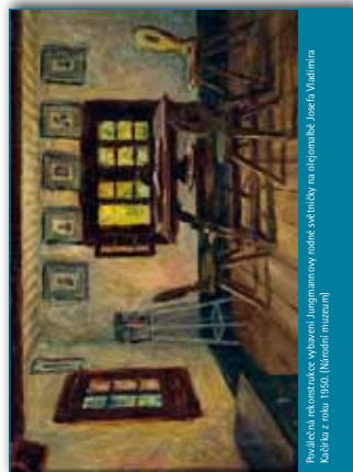
Podoba rekonstrukce vzhledu Jungmannovy rodové světničky na objednávku Josefa Vladimira Kucha z roku 1950.