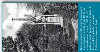
Ústřední pramen Josefa Jungmanna před jeho vnošením jeho manželkou v roce 1823. Byl nahrazen podle návrhu Bedřicha Kucha ve fridštebenské huti v nedávném Novém Jevíkově (kopie dle návrhu ze současných plánů).

Během dlouhé doby své existence prošel domek několika přestavbami. Byl k němu přistavěn výměnek pro staré rodiče s přílehlou komorou, který měl vlastní střechu. Někdy po roce 1867 z praktických důvodů nahradil tehdejší majitel usedlosti Václav Ondráček štíty dvou sousedních staveb jedinou střechou.