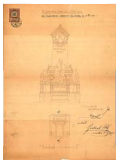
Realizovaný návrh náhrobu Julia Grégra na Olšanských hřbitvech v Praze z 7. února 1898 od architekta Rudolfa Kříženeckého. Náhrobek sochařsky doplnil Bohuslav Schmincl.