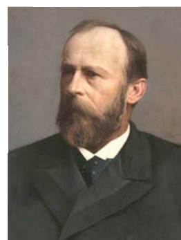
Julius Grégr na portrétu od Julia Maria Sobotky (olej na plátně), 1897. Přelohou k obrazu byla fotografická podoba asi z roku 1891.