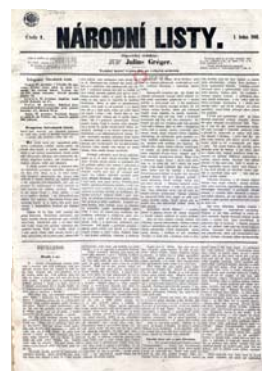
První číslo Národních listů z 1. ledna 1861 vyšlo v nákladu 7000 výtisků. Národní muzeum