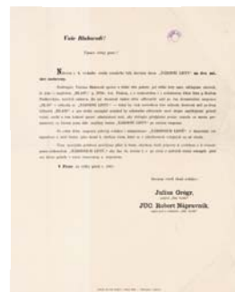
Oznámení o dočasném zastavení Národních listů z cenzurních důvodů z roku 1865. Literární archiv PNP