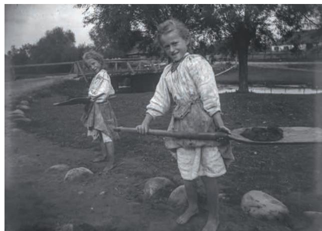
Obr. 5. „Rusínské školačky sbírají trus na návsi“, východní Halič, 90. léta 19. století, ANM, EAO n XXII_290.

Sbírka negativů je uložena jako součást EAO ANM. Do fondu EAO byly negativy předány roku 1981 z Historicko-archeologického oddělení Historického muzea NM