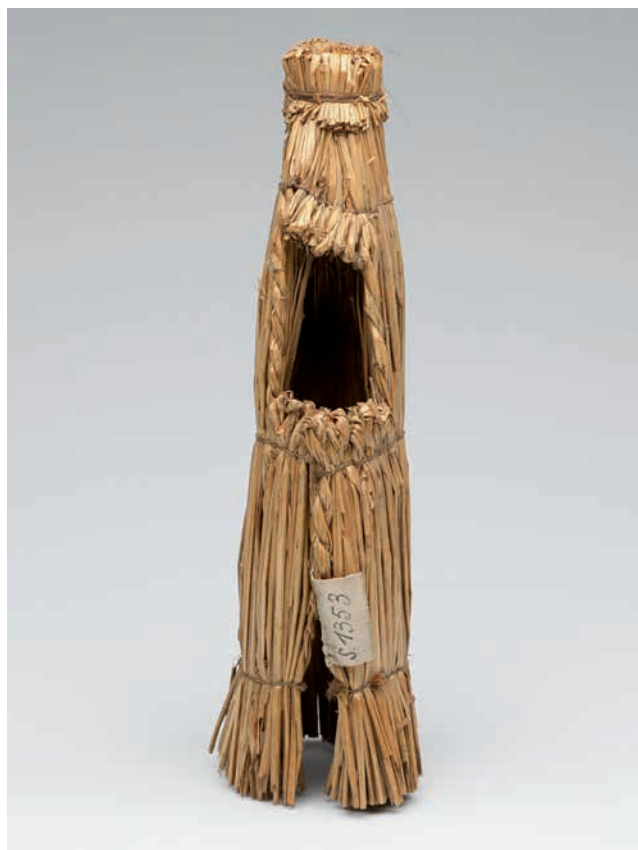
Obr. 12. Model „rohože“ ze sbírky Františka Řehoře, východní Halič, poslední čtvrtina 19. století, NM H4-NS-1353.

Přihlédneme-li k dokumentaci na zadních stranách snímků, odhalíme skutečnou šíři témat, kterou nám F. Řehoř na svých fotografiích přibližuje. Každé téma pak autor propojuje s praktickými stránkami každodenního života lokální komunity. U fotografií církevních staveb se dozvídáme nejen informace spojené s charakterem budovy či vírou, ale také