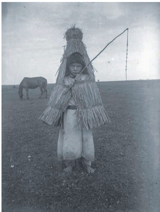
Obr. 11. „Pasák v slaměné rohoži v Berežnici Královské“, Berežnycja, východní Halič, 90. léta 19. století, František Řehoř, ANM, EAO n IX_124.

zaměstnání (polní práce, domácí práce a řemesla), festivity (církvní svátky, výroční a rodinná obřadnost). Jako samostatný celek oba autoři shodně, zřejmě pro jeho široké zastoupení, uvádějí trhy. Valášková pak řadí mezi významné celky oděv. V souboru je zároveň možné odhalit řadu podtémat, s kterými se setkáváme napříč kategoriemi. Jednou z nich je odpočinek 65 či svět dětí. S tématem festivit se prolíná téma hry a tance. Materiál dokumentuje tradiční rozdělení mužských a ženských rolí. Objevují se rovněž témata zastoupená na fotografii pouze okrajově či asociace, které s fotografovaným obsahem vzdáleně souvisejí.