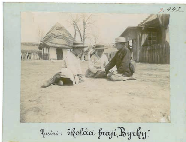
Rusíni : školáci hrají „byrky“