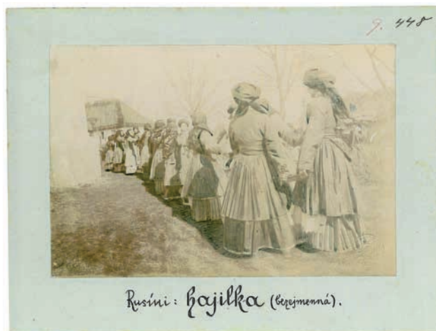
Obr. 2. Příklad retušované fotografie „Rusíni: hájilka (bezejmenná)“, východní Halič, 90. léta 19. století, NM – NpM, sbírka historických fotografií, sig. 9.0448.