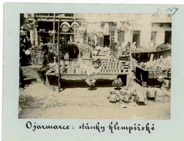
Obr. 8. „O jarmarce: stánky klempiřské“, východní Halič, 90. léta 19. století, NM – NpM, sbírka historických fotografií, sig. 9.0159. Foto František Řehoř.

Období Řehořovy aktivní fotodokumentační činnosti částečně poodhaluje dopis z 24. září 1892 adresovaný Josefě Náprstkové. Dozvídáme se z něj mnohé o způsobu, jakým se Řehoř chystal sbírku fotografií sestavit. Množství požadova-