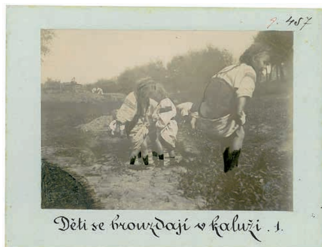
Obr. 3. Příklad retušované fotografie „Děti se brouzdají v kaluži 1.“, Tyškvici, východní Halič, 90. léta 19. století, NM – NpM, sbírka historických fotografií, sig. 9.0457. Foto František Řehoř.

F. Řehoře uložené v Náprstkově muzeu asijských, afrických a amerických kultur. 9