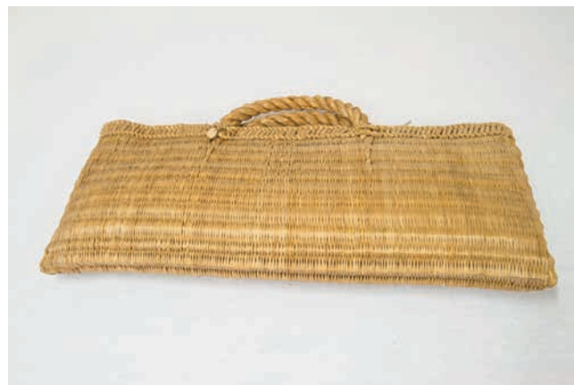
Obr. 14. Pletená taška z orobince ze sbírky Františka Řehoře, východní Halič, poslední čtvrtina 19. století, NM H4-NS-1338.

Fotografická sbírka Františka Řehoře představuje významný zdroj informací, který svým obsahem přesahuje přínos fotografie jako ikonografického pramene. Jedná se o výsledek precizní dlouhodobé badatelské činnosti se záměrem maximalizovat výpovědní hodnotu pořízeného materiálu. Toho se Řehoř snažil docílit pečlivým popisem snímků s odkazy na různé souvislosti s dalšími fotografiemi. Takto pečlivá dokumentace je pro závěr 19. století nadstandardní.