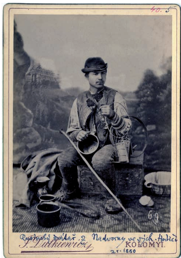
Obr. 1. „Rusínský drátař z Nadvorny ve východní Haliči“, Nadvirna, východní Halič, 1880. Národní muzeum – Náprstkovo muzeum, sbírka historických fotografií, sig. 40.0005. Foto Juliusz Dutkiewicz.

O čtyři roky později připravila Milena Secká CD-ROM, na kterém publikovala kompletní přehled fotografické sbírky