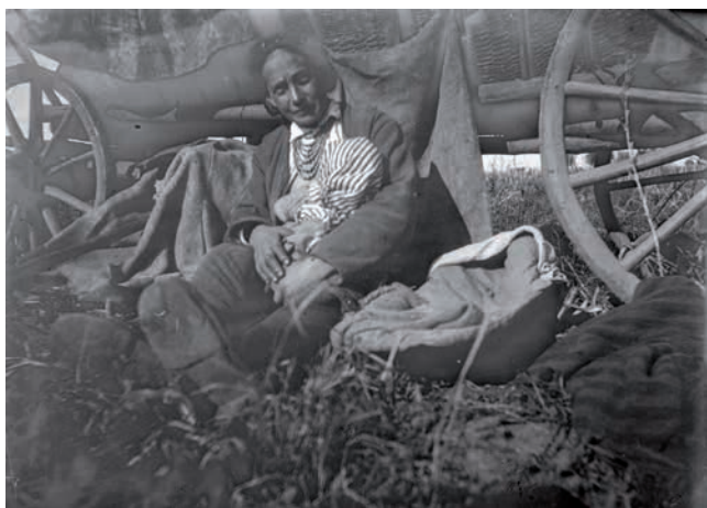
Obr. 4. „Matka na brambořišti kojí“, Židačiv, východní Halič, 90. léta 19. století, František Řehoř, Archiv Národního muzea, EAO n XIII_174.

Výběr z Řehořových snímků byl veřejnosti představen jako součást výstavy Stará Ukrajina Františka Řehoře konané v Národopisném muzeu NM v roce 2019. Převážná většina snímků pocházela z fondu Etnografického obrazového archivu (dále EAO) v Archivu Národního muzea. Několik snímků je rovněž součástí informační brožury, která byla u příležitosti výstavy vydána. 13