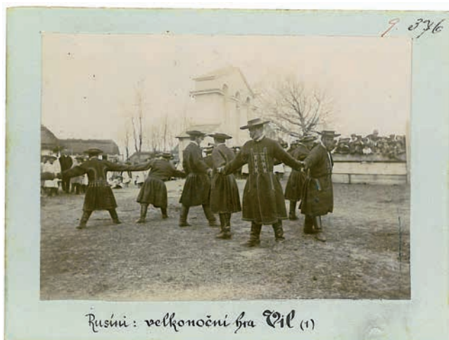
Rusíni : velikonoční hra Vil (1)