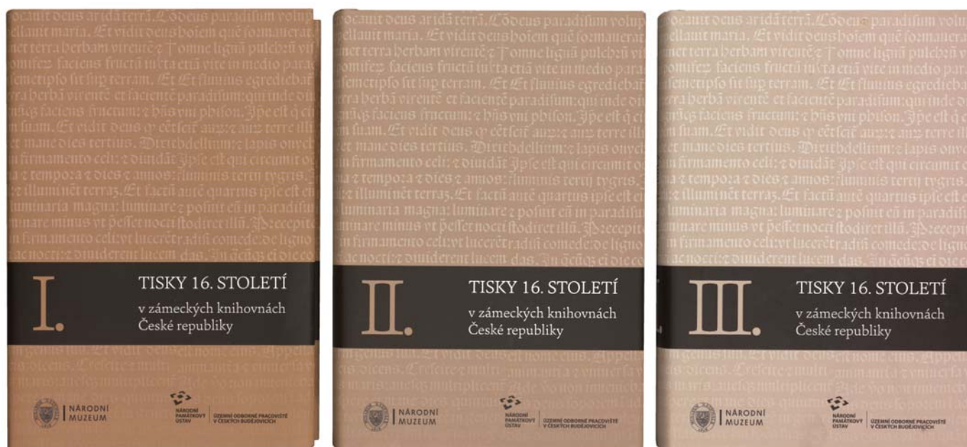
Obr. 1–3. Obálka publikace Tisky 16. století v zámeckých knihovnách , na niž měl významný autorský podíl P. Mašek.