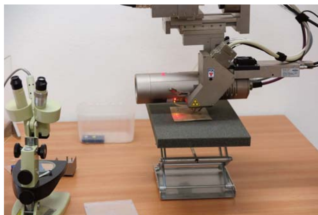
Obr. 4. Prvkové měření dvoulistu Rukopisu královédvorského s použitím rentgen-fluorescenčního mikrospektrometru Bruker Artax 400 (XRF).