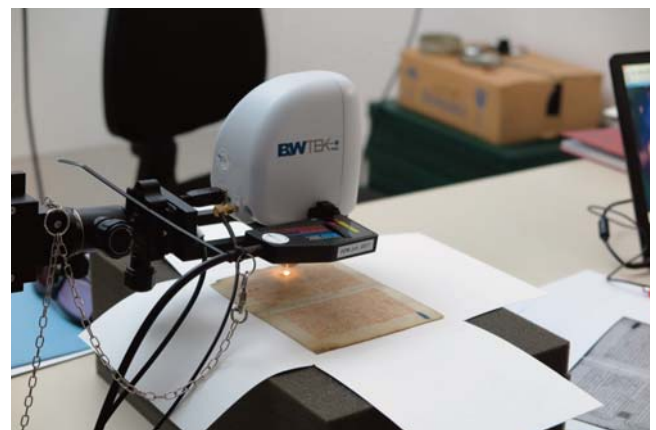
Obr. 2. Průzkum dvoulistu Rukopisu královédvorského Ramanovou spektroskopií.