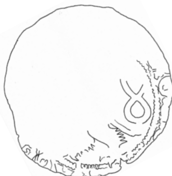
●□1b: Perokresba líce – spodní ražba s dvouocasým lvem a s částí rubního popisu.