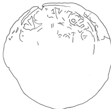
●□1d: Perokresba rubu – spodní ražba s královskou korunou a s částí líčního popisu.

Tato mince představuje kombinaci několika výrobních anomálií, mezi kterými jsou patrné chyby ražební i rytecké, které tvoří dvě základní skupiny chyborážeb mincí. 19 Jako chyby rytecké jsou označovány chyby, které nevznikají z povahy samotného kování, ale z nedostatků při výrobě ražebního kolku. Pro takové chyborážby jsou typická zejména přehozená, vynechaná a nepřidělaná písmena popisu nebo lístice v letopisu. Stejná chyba se teoreticky mohla objevit i na jiných mincích, k jejichž výrobě bylo použito stejné razidlo. Oproti tomu chyby ražební vznikly až na konci výrobního procesu z důvodu nepozornosti přegážky, případně jeho pomocníka. Do této skupiny patří nejen výše uvedené defekty vzniklé opakovanou ražbou na mincovní střížek, ale i různé dvojrázy, excentricky ražené nebo nedoražené mince a ražby inkusní. Každá taková anomálie je v pravém slova smyslu jedinečná, protože lze vyloučit, že by v důsledku výrobního procesu,