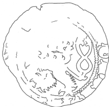
●□1c: Perokresba rubu – vrchní ražba s dvouocasým lvem a s částí rubního popisu.