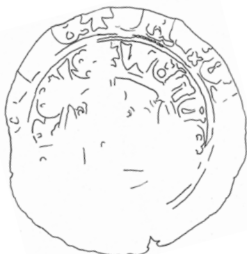
●□1a: Perokresba líce – vrchní ražba s královskou korunou a s částí líčního popisu.