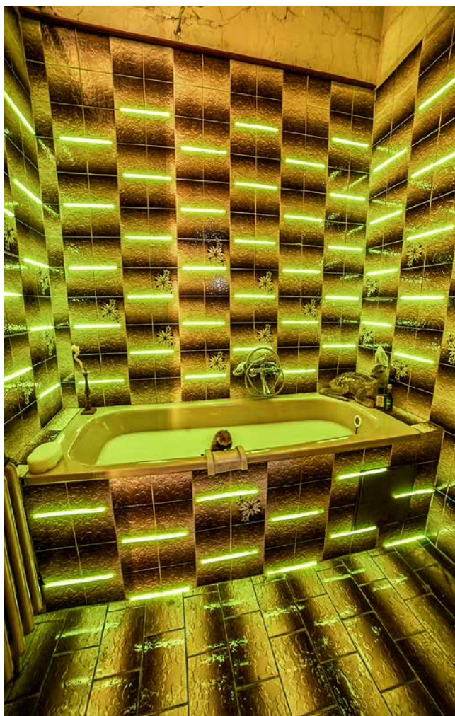
Obr. 5. Klára Zápotocká: Instalace Jádro , detail, ARTakeaway 2021, foto Michal Ureš.

reflektován. Jeho přítomnost v Jádro lze interpretovat jako další paradox. Křeček se totiž koupat nesmí. Pochází ze suchého prostředí, tudíž má sklony k prochlazení a následujícímu nevyhnutelnému exitu. „Memento mori platí i pro hlodavce z čeledi myšovití,“ dodává autorka.