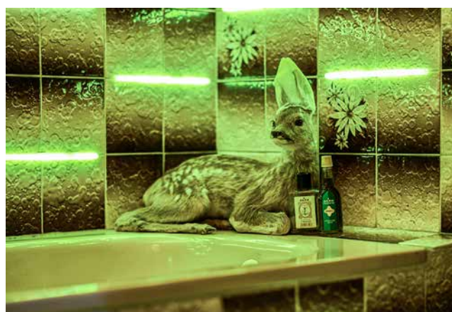
Obr. 4. Klára Zápotocká: Instalace Jádro, detail, ARTakeaway 2021, foto Michal Ureš.