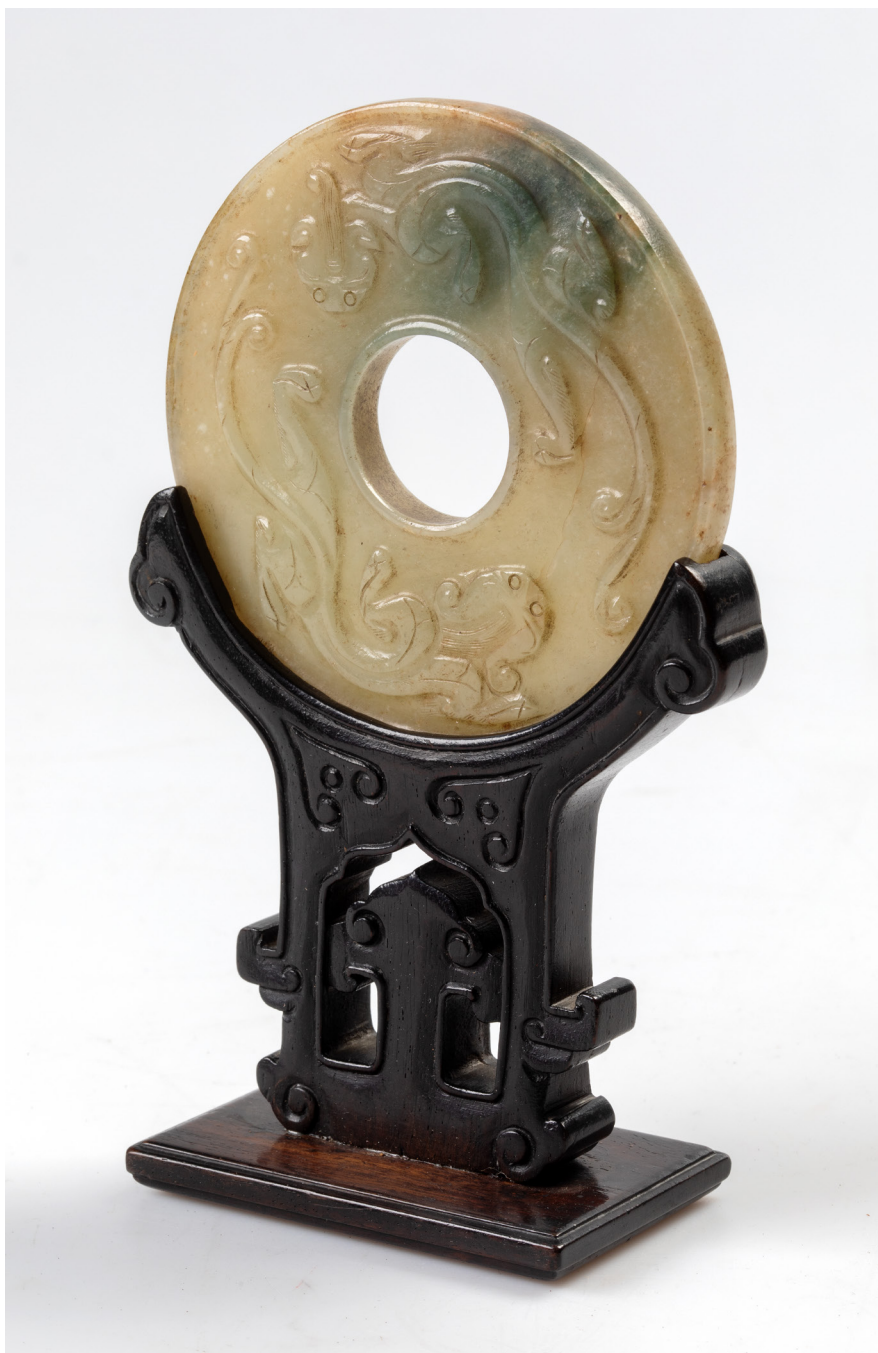
Obr. 5 Disk na dřevěném podstavci, s dekorem v archaickém stylu: na jedné straně dva draci, na druhé stylizovaná oblaka. Kámen jü (nefrit), dřevo. Průměr 9,2 cm, výška celková 16,2 cm Čína, datace disku nejasná, podstavec 19./20. stol. Rodina Junowiczových, Teplice, konfiskát 1947. Náprstkovo muzeum, inv.č. 17019.

Innsbruck: StudienVerlag, 2002, s. 414–415.