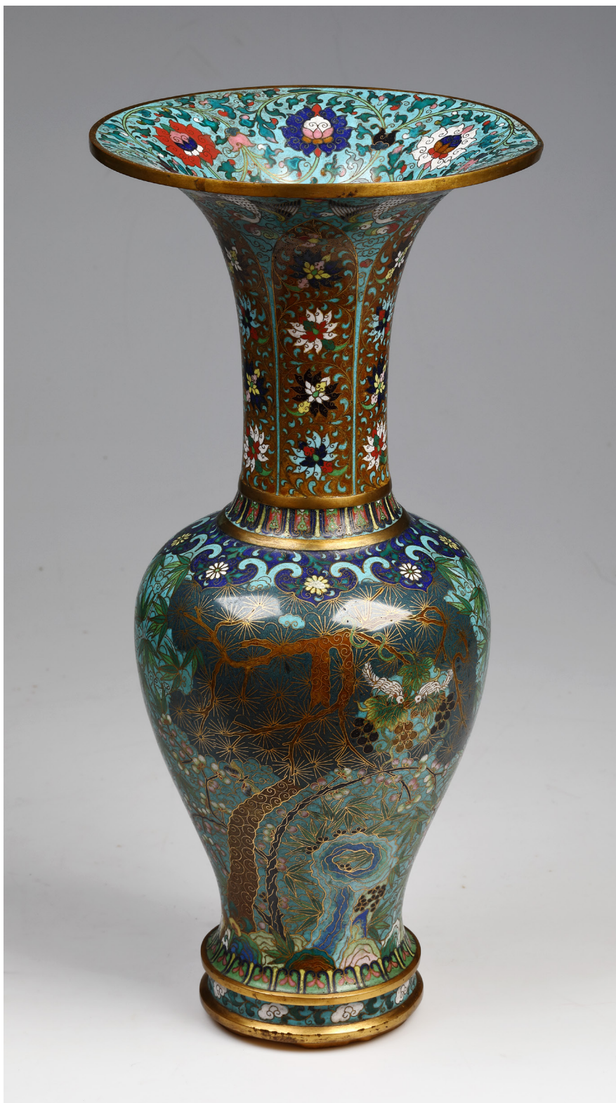
Obr. 3 Váza. Cloisonné. Výška 43,8 cm, průměr ústí 20,4 cm. Čína, dynastie Čching (1644–1911) Rodina Junowiczových, Teplice, konfiskát 1947. Náprstkovo muzeum, inv.č. 18978.

odehrála na pohraničním území u města Kalgan, dnes zvaného Čang-fia-kchou (Zhangjiakou 張家口). V té době asi sedmdesát tisícové město představovalo důležité obchodní spojení Číny s Mongolskem a též s carským Ruskem. Operaci velel německý hrabě Maximilian hrabě Yorck von Wartenburg. 17 Během tří týdnů od 12. listopadu do 4. prosince 1900 urazila vojska přibližně pět set kilometrů v neobyčejně