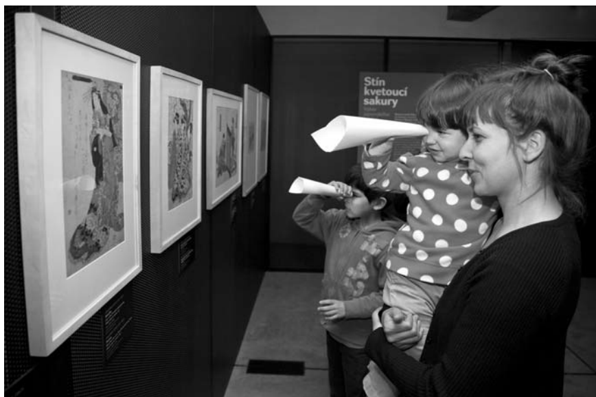
Obr. 1: Animační program k výstavě Stín kvetoucí sakury / Výběr japonského umění z českých sbírek 2012, Muzeum umění Olomouc / Arcidiecézní muzeum Olomouc.

Co umění umí je pravidelný cyklus animačních programů MUO pro děti od 2 do 6 let a jeho název je naprosto výstižný. Je v něm obsaženo vše, o co se každý měsíc již třetím rokem snažím - přivést do muzea rodiče s nejmenšími dětmi a zprostředkovat jim aktuální výstavy. První animace byla uskutečněna v létě 2011 a vzešla z aktivity rodičů olomouckého rodinného centra Heřmánek. Z jedné výtvarné akce pro nejmenší vyrostl dlouhodobý, pravidelný a navštěvovaný program. Podobný formát programů již najdeme v nabídce většiny tuzemských muzeí a galerií.