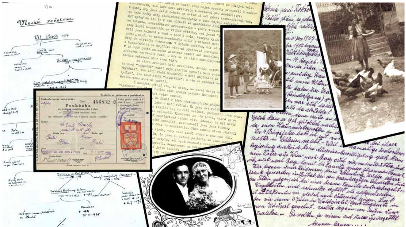
Obr. č. 3. Ukázky dokumentů Databáze dějin všedního dne.

obsahu. Kromě stručného resumé se tak může dozvědět např. o jakých lokalitách text pojednává nebo o jaké časové období se jedná. Po rozkliknutí tlačítka „Zobrazit plný text“ si pak každý může zobrazit konkrétní text v PDF formátu, případně si ho stáhnout. Některé dokumenty nemohou být v databázi zveřejněny, ty je však možné prostudovat v prostorách badatelské knihovny Historického ústavu AV ČR.