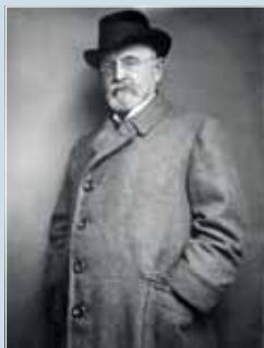
Alois Jirásek