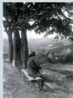
Alois Jirásek na oblíbené lavičce nad Hronovem, 1919