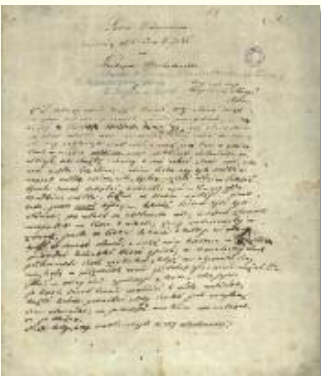
Chocholouškův rukopis nedokončené povídky Dcera Vřšovcova, která vznikala v době jeho pobytu v Haliči (Literární archiv PNP)