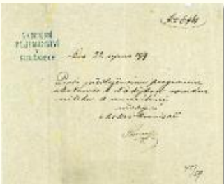
Povolení C. k. okresního hejtmanství v Sedlčanech z 22. srpna 1879 uspořádat slavnost u příležitosti odhalení pomníku P. Chocholouška v Nadějkově (Literární archiv PNP)