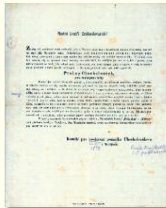
Výzva ke sbírce na postavení pomníku na hrobě P. Chocholouška, vydaná Komitétem pro postavení pomníku Chocholouškova v Nadějkově