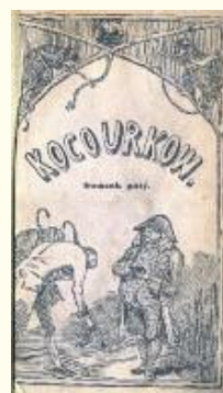
Obálka prvního vydání Chocholouškovy knihy Kocourkov aneb Pamětnosti převětického města Kocourkova a obyvatelů jeho, která vyšla nákladem Jaroslava Pospíšila v Praze roku 1847 (Národní muzeum)