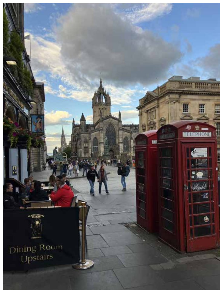
Pohled na St Giles' Cathedral z High Street v Edinburghu.

Navzdory pověsti Edinburghu jako chladného, deštivého města, bylo velmi pěkné a slunné počasí, což vybízelo k večerním procházkám. Ještě dlouho po dvaadvacáté hodině bylo nebe nad Edinburghem jasné díky letnímu období a umožnilo průzkum genia loci s ikonickými památkami, úzkými uličkami a malebnými zákoutími hlavního města Skotska. Svou účast na této konferenci považuji za skvělou příležitost k prezentaci části české sbírky hudebních nástrojů, která měla mezi západoevropskými účastníky konference velký ohlas. Domnívám se, že stejně jako já, tak také většina přednášejících odjížděla z Edinburghu plna entuziasmu z velmi inspirujícího setkání.