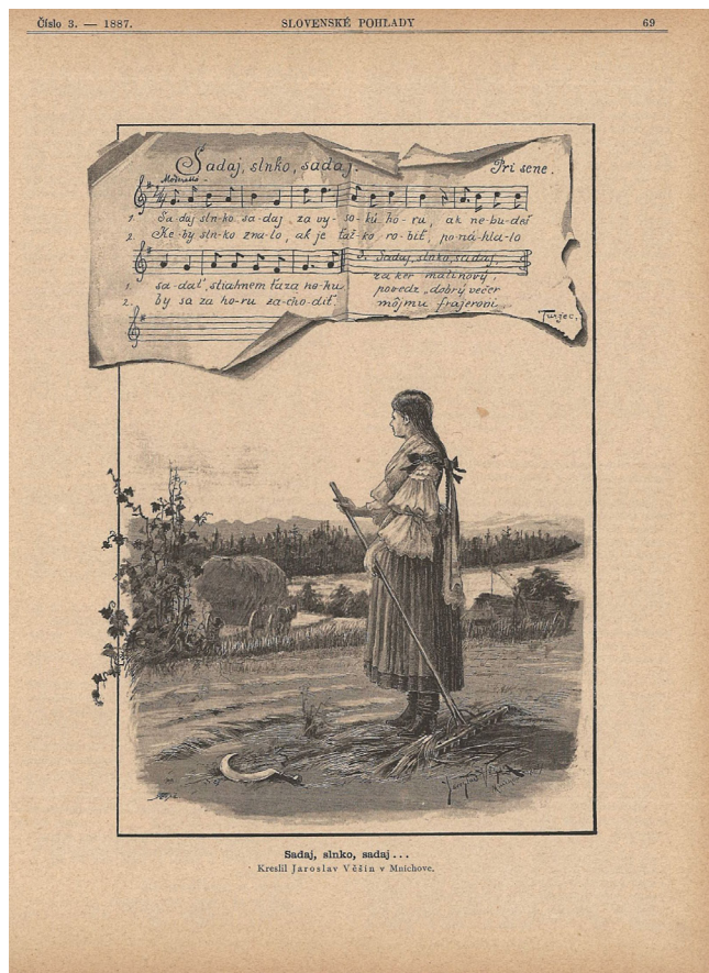
Obr. 3. Sadaj, slnko, sadaj ... Kreslil J. Věšín. Slovenské pohľady 7, 1887, č. 2, s. 33.

pravidelné správy z českých krajín a posilňoval snahy o česko-slovenskú spolupatričnosť. Do svojho programu si dal obrodu slovenskej národnej politiky a propagovanie spolupráce Čechov a Slovákov. Noviny reagovali na viaceré otázky česko-slovenskej vzájomnosti či už teoretického charakteru, alebo propagovali konkrétne prejavy spolupráce medzi Čechmi a Slovákami v praxi so zvláštnym akcentom na činnosť Československej jednoty. 48 Prvý starosta spolku profesor slovanskej filológie na českej univerzite v Prahe František Pastrnek to ocenil na valnom zhromaždení spolku koncom januára 1899: „Z časopisov slovenských Slovenské listy a Hlas , ktoré sú snahám spolku neobyčajnou ochotou na pomoc.“ 49 Na popularizáciu aktivít tohto spolku boli Slovenské listy označené ako „druhý orgán Jednoty a ... zaprisahaný nepriateľ všetkého, čo na maďarstvo upomína“. 50