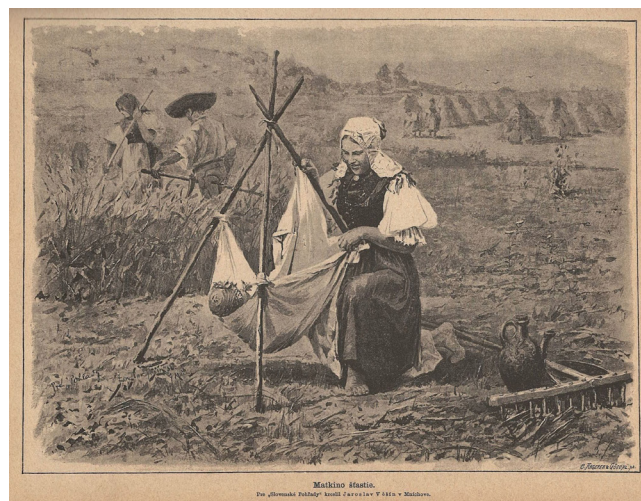
Obr. 1. Matkino šťastie. Kreslil J. Věšín. Slovenské pohľady 7, 1887, č. 1, s. 9.

Významnú úlohu v slovenskom národnom hnutí do rozpadu monarchie zohral tlačový orgán SNS Národné noviny . Začal vychádzať v Turčianskom Sv. Martine v roku 1870 ako pokračovateľ Pešťbudínskych vedomostí . 26 Noviny venovali dominantnú pozornosť otázkam spätým so slovenským národným hnutím. Až do polovice 70. rokov 19. storočia sa záujem o otázku česko-slovenskej vzájomnosti na ich stránkach výraznejšie neprejavil. Boli to skôr informatívne kratšie či obsirnejšie články o rôznych stránkach