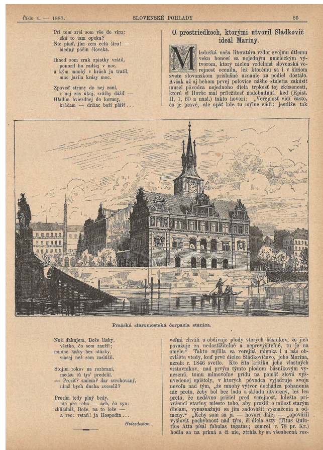
Obr. 4. Pražská staromestská čerpacia stanica. Slovenské pohľady 7, 1887, č. 4, s. 85

Táto myšlienka bola v popredí článku v Hlase od V. Šrobára pod názvom Vzájomnosť československá! Upozornil v ňom, že vzájomnosť medzi Čechmi a Slovákmi nie je „výmysel dneška, ona trvá už od historických dôb“. Dôrazne odmietol všetky diskusie o splynutí oboch národov v politickom zmysle. Taktiež nesúhlasil s názorom o jednotnom spisovnom jazyku. Predpokladom rozvíjania vzájomnosti bolo podľa neho to, aby sa Česi a Slováci vzájomne poznávali a poznali. Napísal: „Treba vám i nám poznať nielen pomery naše ku štátu a našim nepriateľom, ale i náš vnútorný život a všetko, čo s tým súvisí: školské, náboženské, literárne, sociálne i hospodárske pomery“ 92 Považoval za dôležité, aby sa vzájomná pomoc, láska a poznanie neuskutočnilo len medzi hŕstkou inteligencie, ale malo preniknúť medzi čo najširšiu vrstvu oboch národov. Na význam českej pomoci Slovákom poukazyval V. Šrobár v článku Maďarizácia a to v súvislosti s rozširujúcou sa maďarizáciou v Uhorsku a jej hlbokým zásahom do „nášho verejného i súkromného života“. Navrhol tri možnosti, ako sa obrátiť proti tejto „skaze“ – knižnou, rodinnou výchovou a štúdiom na českej škole. Vyzdvihol aktivity Československej jednoty v tejto oblasti: „Od vyše dvadsiatich rokov neurobili sme