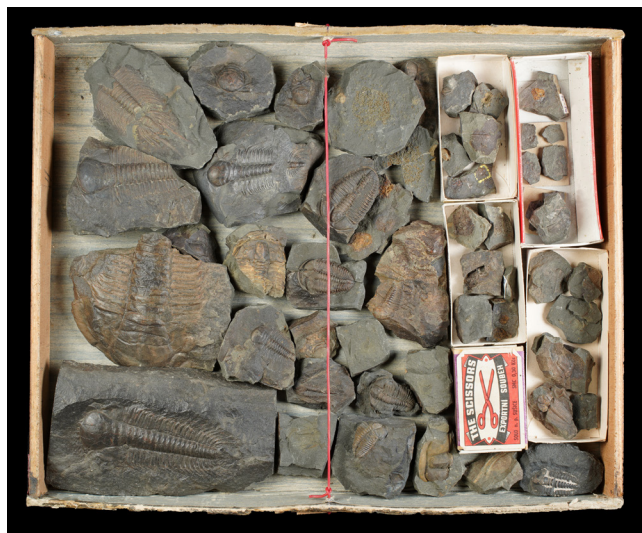
Obr. 3. Ukázka původního uložení sbírky.