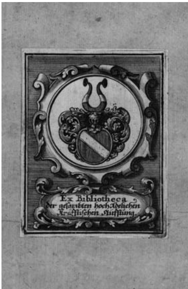
Exlibris Raymunda Kraffta, starosty města Ulm z počátku 18. století

Katolická postila Martina Eisengreina vydaná v Ingolstadtu v roce 1583 (VD 16 E 812) nese na předním přidešti dobové dřevořezové kolorované heraldické exlibris: na pokosem děleném zlatočerném štítě stříbrná ruka s kladivem, v klenotu s pohanskou korunou s šesticípmi hvězdami na konci zlatočerných rohů a s textem „FAMIL: SCHMIDNERORUM SVPELLEX LIBR.“ Jde pravděpodobně o erbem obdařený měšťanský rod, který se prozatím nepodařilo identifikovat. Totožné exlibris se nachází na konvolutu prvotisků a tisků 16. století ve Vědecké knihovně v Olomouci. 17 Olomoucký konvolut je vevázán do téže světlé pergamenové vazby stejně jako rájecký tisk a je doplněn vpiskem „...Joannis Georgii Schmidners...“. Ve zmíněné knihovně v Olomouci není toto exlibris ojedinělé. Objev druhého výskytu tohoto exlibris a opět na Moravě napovídá, že by mohlo jít o moravskou měšťanskou knihovnu konce 16. století.