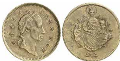
●□4: UHRY, František I. (1804–1835), mincovna Vídeň, polotovar 20 krejcaru.