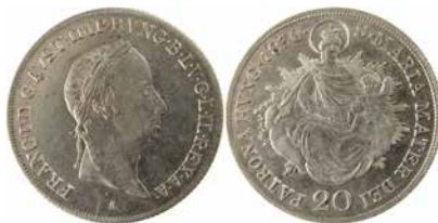
●□2: UHRY, František I. (1804–1835), mincovna Vídeň, 20 krejcar 1830.