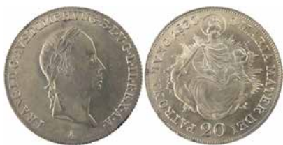
●□1: UHRY, František I. (1804–1835), mincovna Vídeň, 20 krejcar 1830.