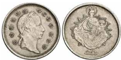
●□5: UHRY, František I. (1804–1835), mincovna Vídeň, polotovar 20 krejcaru.