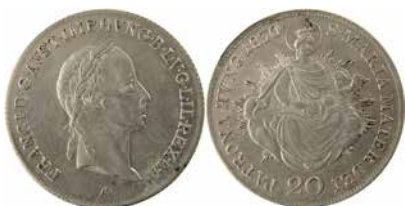
●□3: UHRY, František I. (1804–1835), mincovna Vídeň, 20 krejcar 1830.