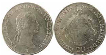
●□6: UHRY, František I. (1804–1835), mincovna Kremnice, 20 krejcar 1834.