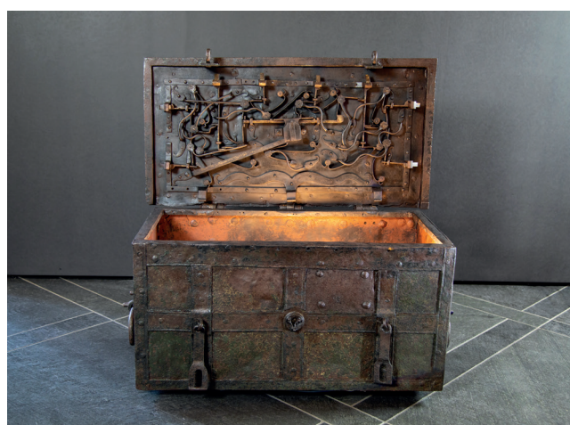
Obr. 10. Válečná truhla; pancéřovaná a vhodná pro použití v poli s důmyslným uzamykacím mechanismem, Zbrojnice, Státní umělecké sbírky Drážďany, Německo.

Uprostřed výstavního prostoru se nacházel stůl rozdělený čarami oddělujícími jednotlivá témata. Byly zde umístěny originální předměty, mimo jiné Valdštejnovy boty vypůjčené z Chebského muzea, válečná truhla uprostřed a řada originálních mincí z různých evropských zemí včetně českých. Na stěnách byly umístěny originální tisky a repliky (na pravé stěně), které představily stejná témata jako na uvedeném stole: finanční zájmy vojevůdců a financování armád, inflaci, evropský původ žoldnéřů, výcvik a každodenní život vojáků.