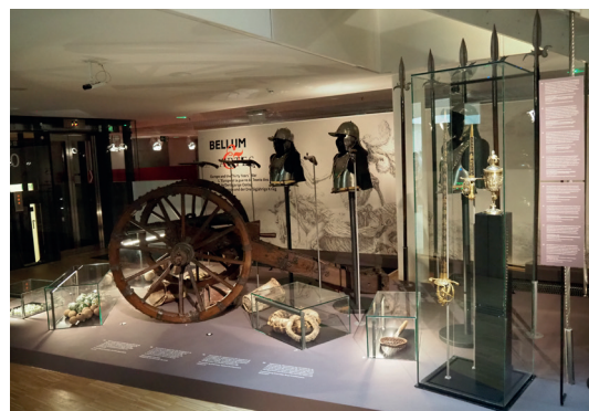
Obr. 1. Bellum et Artes – Evropa a třicetiletá válka , úvod do výstavy

Výstava v Bruselu představila 150 předmětů a jejich osudy za třicetileté války i po jejím skončení, a to z evropské perspektivy. V úvodní části výstavy byla k vidění sbírka dobové válečné výzbroje a tři umělecká díla – z toho dvě reprezentativní zbraně. Tyto dva soubory představily název výstavy Bellum et Artes (Válka a umění).