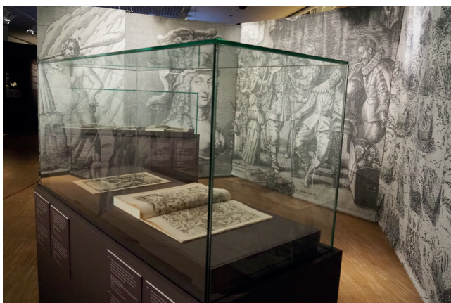
Obr. 12. Bellum et Artes – Evropa a třicetiletá válka, válka v médiích ; Foto 2025 Dům evropských dějin, Brusel, Belgie © EU, Evropský parlament

Třicetiletá válka byla také válkou mediální, válkou obrazů. Všechny válčící strany využívaly umělecká díla v tiskovinách k propagandistickým účelům. Protivníci na sebe útočili ostrými pery, břitkou satirou a šířením „fake news“. Detaily obrazů, které byly součástí válečné propagandy v různých částech Evropy, utvořily hlavní design stěn v této kapitole. Dvě volně stojící vitríny představily ukázky originálních stránek s lepty z Theatrum Europaeum , nejvýznamnější kroniky evropských dějin té doby, která informovala čtenáře o hlavních událostech třicetileté války.