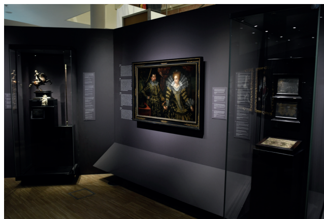
Obr. 6. Bellum et Artes – Evropa a třicetiletá válka , protagonisté: Sasko a rakouští Habsburkové; Foto 2025 Dům evropských dějin, Brusel, Belgie © EU, Evropský parlament

Politické vazby v Evropě 17. století přiblížila interaktivní část s názvem Sňatky a aliance. Během třicetileté války představovaly sňatky strategická spojení, která byla vedena politickými, ekonomickými a náboženskými motivy. Existovala tak síť rodinných spojení, což vedlo mnohdy k novým konfliktům. Interaktivní pomůcka představila konkrétní manželské páry včetně cest, které vedly k jejich sňatkům nebo s nimi souvisely.