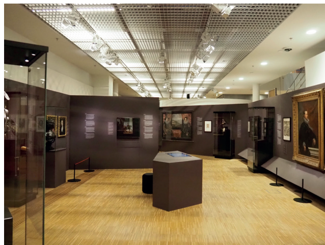
Obr. 5. Bellum et Artes – Evropa a třicetiletá válka , protagonisté; Foto 2025 Dům evropských dějin, Brusel, Belgie © EU, Evropský parlament

Většina válčících stran byla zastoupena také uměleckými díly ve vitrínách, která poukazovala na jejich zájmy ve válce a způsob, jakým využívaly umění k dosažení svých cílů.