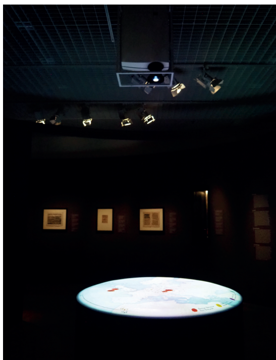
Obr. 4. Bellum et Artes – Evropa a třicetiletá válka , projekce hlavních událostí třicetileté války

Kruhová projekce uprostřed zobrazovala výběr hlavních událostí třicetileté války, které se v Evropě v letech 1618 až 1648 udály: bitvy, obléhání měst, plenění, masakry, politické události. Projekce se stala zároveň časovou osou třicetileté války a pomůckou, jak vysvětlit charakter a rozsah konfliktu, kdy ve většině zúčastněných evropských zemí docházelo k mnoha událostem v různých časových obdobích a s rozdílným dopadem.