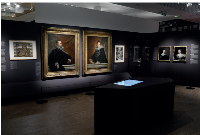
Obr. 7. Bellum et Artes – Evropa a třicetiletá válka , protagonisté: Jižní a Severní Nizozemí; Foto 2025 Dům evropských dějin, Brusel, Belgie © EU, Evropský parlament