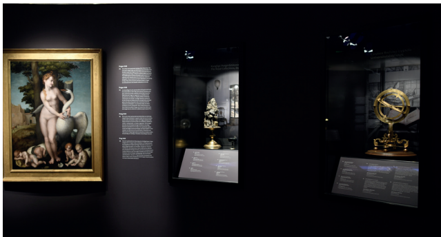
Obr. 15. Bellum et Artes – Evropa a třicetiletá válka, umění a umělci za války ; Praha; Foto 2025 Dům evropských dějin, Brusel, Belgie © EU, Evropský parlament