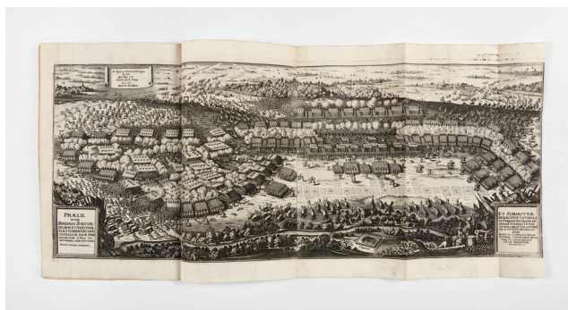
Obr. 13. Matthäus Merian starší (1593–1650). První bitva u Breitenfeldu v září 1631. In: Theatrum Europaeum , sv. 2. Rytina, Frankfurt n. M., 5. nebo 6. vydání, 1679. Dům evropských dějin, Brusel, Belgie, Umění a umělci za války

Umělecké sbírky a knihovny patřily k velmi žádané válečné kořisti, po které toužili evropská vládcí i jejich vojevůdci. Vítězové na všech stranách konfliktu loupi-li umělecká díla v dosud nevídaném rozsahu, což bylo v té době – za určitých podmínek – jejich legitimním právem. Přidávali je do svých sbírek, rozdávali výměnou za protislužby, anebo dále prodávali. Došlo tak k nové distribuci uměleckých předmětů a knih v Evropě a tento druh válečné kořisti se stal významnou součástí dnešního společného kulturního dědictví Evropy.