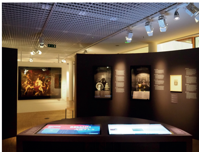
Obr. 14. Bellum et Artes – Evropa a třicetiletá válka, umění a umělci za války: Mnichov, Stuttgart a Heidelberg

Třicetiletá válka ovlivnila také osudy umělců. Některým vytvořila nová pole působnosti, jiní ztratili své klienty, byli nuceni konvertovat, odešli do exilu nebo do války. Vedlejším produktem nucené migrace umělců se v Evropě stala kulturní výměna. Uprostřed kruhového prostoru byl umístěn stůl s dvěma interaktivními obrazovkami. Zde se mohli návštěvníci dozvědět podrobnosti o migraci umělců a o cestách, kterými ukořistěné umění „putovalo“ Evropou. Návštěvníci si na displeji mohli vybrat jednotlivé umělce nebo zadat jejich jména pomocí klávesnice. Druhá obrazovka podobným způsobem mapovala příběhy ukořistěných uměleckých děl. Obsah těchto interaktivních obrazovek vznikl v rámci mezinárodního výzkumného projektu Bellum et Artes a partneři projektu ho průběžně rozšiřují.