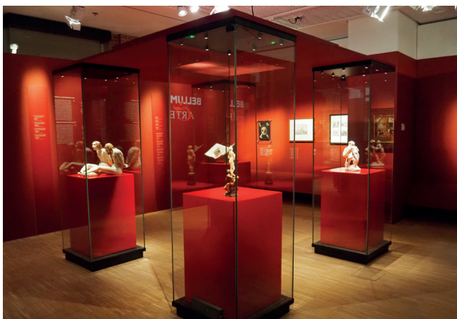
Obr. 11. Bellum et Artes – Evropa a třicetiletá válka, hrůzy války Foto 2025 Dům evropských dějin, Brusel, Belgie © EU, Evropský parlament