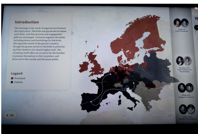
Obr. 8. Bellum et Artes – Evropa a třicetiletá válka , interaktivní část Sňatky a aliance; Foto 2025 Dům evropských dějin, Brusel, Belgie © EU, Evropský parlament