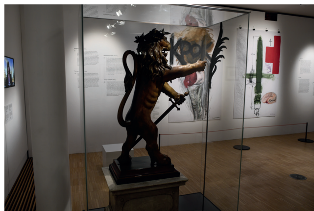
Obr. 18. Bellum et Artes – Evropa a třicetiletá válka, oslavy míru a současnost ; Foto 2025 Dům evropských dějin, Brusel, Belgie © EU, Evropský parlament

Soubor doplnily dva tisky související s oslavami a vyhlášením konce války. Na konci této poslední kapitoly o třicetileté válce byla ve vitrině umístěna velká socha tzv. vinného lva, která byla použita při oslavách v Norimberku roku 1649.