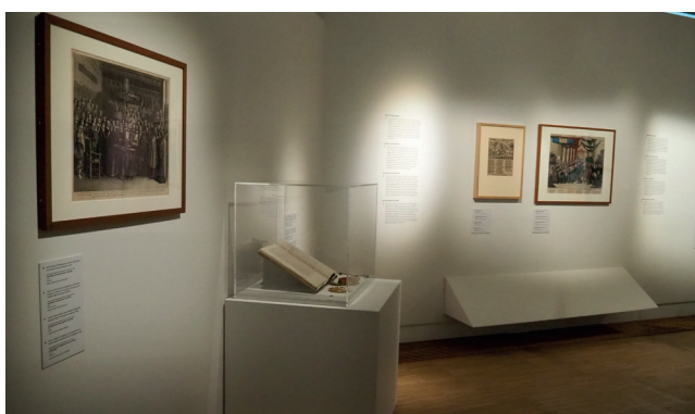
Obr. 16. Bellum et Artes – Evropa a třicetiletá válka, cesta k míru: moderní mezinárodní právo ; Foto 2025 Dům evropských dějin, Brusel, Belgie © EU, Evropský parlament

Mírová jednání v Osnabrücku a Münsteru trvala několik let. Nakonec byla úspěšná, protože se na nich podílely všechny válčící strany. Právní experti položili základy moderního mezinárodního práva a omezili právo vést válku na suverénní státy. Vestfálský mír vytvořil politická schémata, právní a politické zásady, které mají význam dodnes. Reorganizoval rovněž Svatou říši římskou a přiznal suverenitu Nizozemí a Švýcarsku. Hlavní vizuální dominantou uprostřed prostoru se stal obraz Alegorie míru podle Rubensovy stejnojmenné předlohy. Naproti obrazu byly umístěny dvě vitríny, jedna s knihami vlivných právníků, kteří byli důležití pro mírová jednání, a druhá s originálem mírové smlouvy z Osnabrücku.