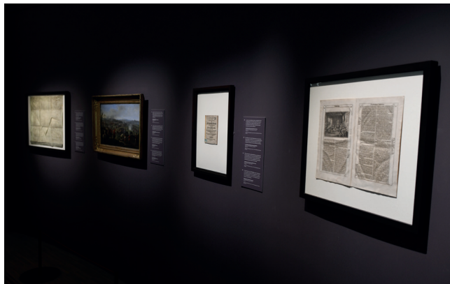
Obr. 3. Bellum et Artes – Evropa a třicetiletá válka , Evropa – sud střelného prachu; Foto 2025 Dům evropských dějin, Brusel, Belgie © EU, Evropský parlament

Vystavené předměty ilustrovaly hlavní příčiny vypuknutí třicetileté války, výchozí bod – Pražskou defenestraci v roce 1618 a události vedoucí k bitvě na Bílé hoře v roce 1620.