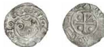
1.1. ČECHY, Boleslav II., Cach 89.

Pokyny pro autory najdete na www.nm.cz/publikace .