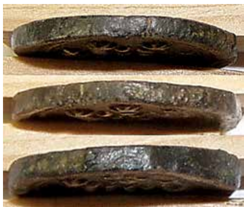
●□9: Ukázka hran tlustého peníze.

S ohledem na výše uvedené argumenty lze konstatovat, že provedení typu lva u tlustého peníze se shoduje s provedením u typu Hána V/4. Koruna s perlovcem odpovídá standardnímu provedení Rad. I.26 (Cast. 80). Fotografie hrany tlustého penízu jsou vyobrazeny na obrázku 9. Z celkového provedení penízu je pravděpodobné, že k jeho vytvoření nebylo použito průbojníku, ale postupného ostříhání. I když na minci jsou patrné stopy přehnutí materiálu z hrany mince směrem do jejího středu, jež se vyskytuje na několika místech na rubu i lici, nelze je považovat za jednoznačný důkaz stop po klopování. Takže závěry o tom, jestli se jedná o ostříhaný etalon, či zatím nepopsaný tlustý peníz, nelze jednoznačně uzavřít.