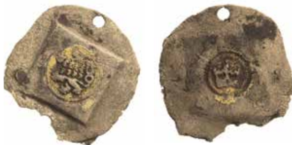
●□4: Etalon v Chaurově sbírce č. 382.

Dalším etalonem je etalon nacházející se v Chaurově sbírce pod číslem 382. 9