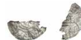
1.3. ČECHY, Boleslav III., Cach 194.