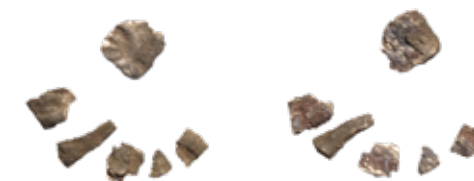
2.2. ČECHY, Břetislav I., Cach 324?

Naleziště: Dziekanowice , hrob 27/96 [PL].