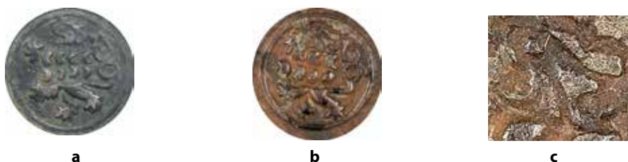
●□8: Porovnání detailu tlustého peníže (a), etalonu Jevíčko (b) a detailu hlavy z etalonu Jevíčko (c).