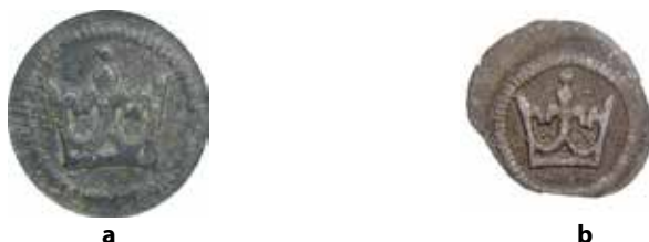
●□2: Porovnání detailu tvaru koruny na tlustém penízu (a) a haléři s perlovcem (b).

Provedení koruny je zcela shodné s korunami na haléřích s perlovcem. Úzká směrem nahoru se rozšiřující koruna složená z jedné celé a dvou postranních lilií. Nad prostřední lilií je vyražena výrazná perla. Krajní lilie perlu nemají. Čelenka koruny je naznačena spodní mírně prohnutou linkou a dvěma oblouky, které spojují prostřední lilií s krajními. V ploše mezi liliemi nejsou patrné žádné obrazce. Z těchto důvodů ji lze bezpečně přiřadit k typu Rad. I.26 5 (Cast. 80).