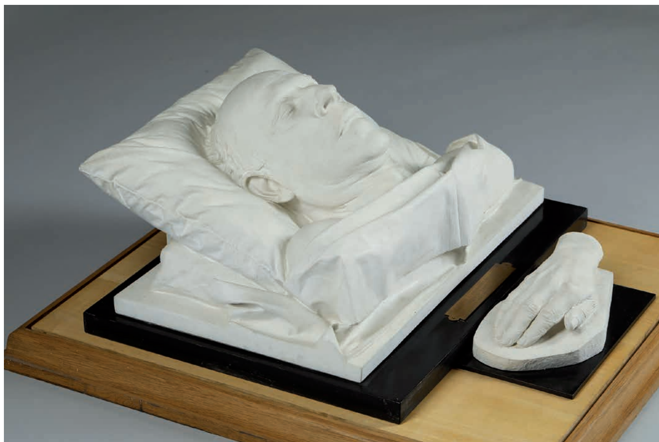
Obr. 1. Posmrtná maska a odlitek ruky Antonína Zápotockého.

a to včetně dobrovolných hasičů. 16 Program byl rozdělen na dopolední a odpolední část a zúčastnil se ho také Ladislav Zápotocký se synem Antonínem, který „... si pamatoval, že byly řeči, tleskání a že nakonec bylo hlasováno“. 17 Kladenský První máj se konal v oblíbeném lesním hostinci U Hvězdy a celé oslavy probíhaly vcelku poklidně, než byl závěrečný průvod rozehánán kvůli potyčce s četníky snažícími se zabavit rudý prapor. 18