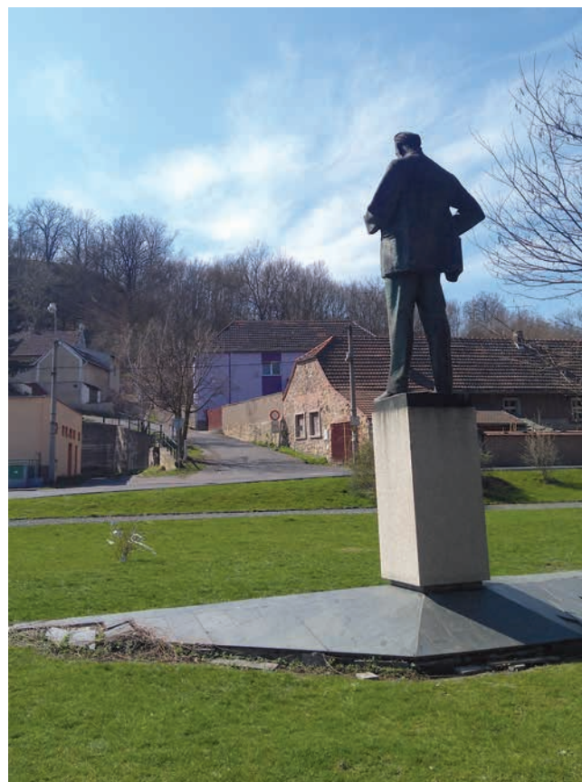
Obr. 5. Pomník Antonína Zápotockého v Zákolanech s pohledem na jeho domnělý rodný dům. Stav 2019.

Záměr se skupině vcelku podařil, neboť diskuse o budoucnosti památníku a dominanty obce trvá do dnešních dní. Akce si vysloužila jak pozitivní, tak negativní reakce, např. okresní výbor Klubu českého pohraničí – tedy součást kontroverzního a možná až bizarního občanského sdružení,