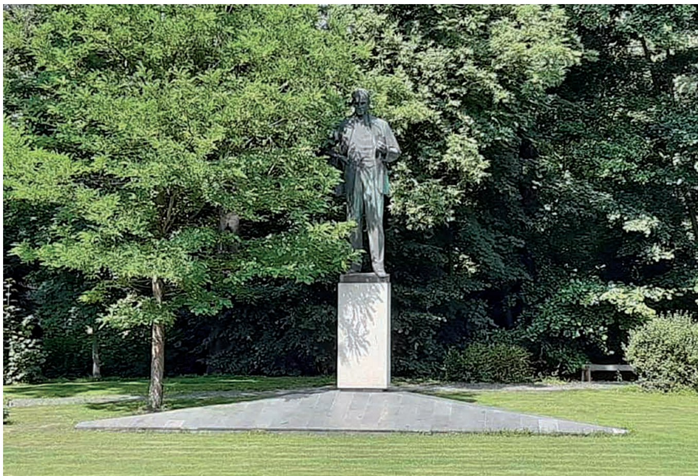
Obr. 4. Pomník Antonína Zápotockého v Zákolanech po rekonstrukci soklu. Stav 2021.

upravenou cestou vedoucí k řečenému pomníku, přičemž Zápotockého socha, tyčící se do výšky sedmi metrů, se stala skutečně jakýmsi objektem uctívání, k čemuž byl ostatně koncept umístění sochy naplánován.