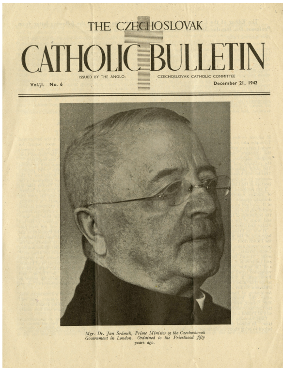
Obrázek 3 – Titulní strana Československo katolického bulletinu z prosince 1942 s portrétem Jana Šrámka (NA Praha, f. MV-L, k. 294).

krále Bedřicha (Fridricha) Falckého za 35 liber. Předseda vlády na tuto nabídku výstižně napsal: „Koupit!“ 74