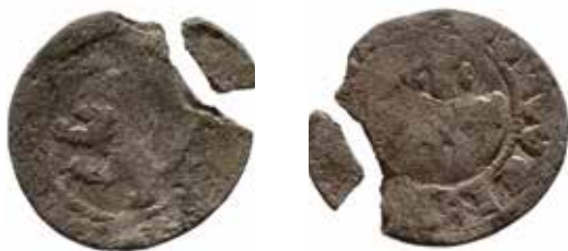
●□4: Jan I. Lucemburský (1310–1346), mincovna Kutná Hora , parvus.