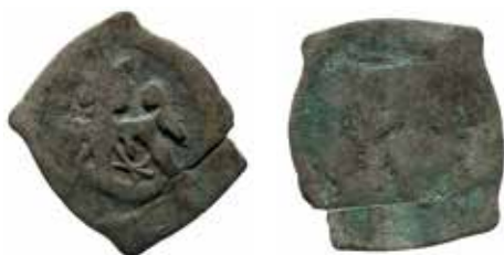
● 1: MORAVA, Jošt I. Lucemburský (1375–1411), mincovna Brno , haléř se čtyřhrázem.