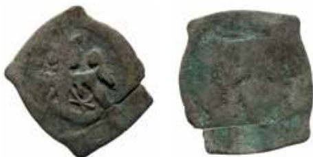
● 1: MORAVA, Jošt I. Lucemburský (1375–1411), mincovna Brno, halé se čtyřtřířezem.