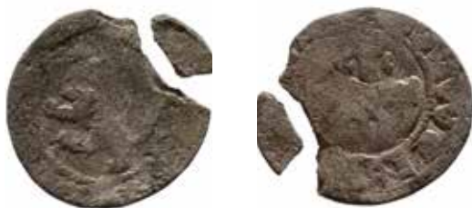
●□4: Jan I. Lucemburský (1310–1346), mincovna Kutná Hora, parvus. Naleziště: Kutná Hora – Cuthna Antiqua 1988.