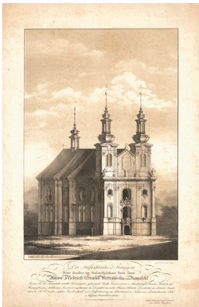
Obr. 1. BSCHOR, Carl. Die Stiftskirche in Raygern... Wien: Carl Bschor, 1821. Knihovna Benediktinského opatství Rajhrad, R-GR-138,59.

Vlastní litografická dílna Hospodářské společnosti bohužel nenavázala bližší spolupráci s brněnskými tiskaři a po roce 1821 se s litografiemi pocházejícími z této dílny již nesetkáváme. Od poloviny 20. let pak Hospodářská společnost spolupracovala s brněnskou kamenotiskárnou bratří Trasslerů, u nichž nechávala vydávat litografické přílohy svých tisků či obrazové i tištěné prémie pro své členy. 13 Řadu zakázek pro Hospodářskou společnost vytvářeli také vídeňští či pražští litografové.