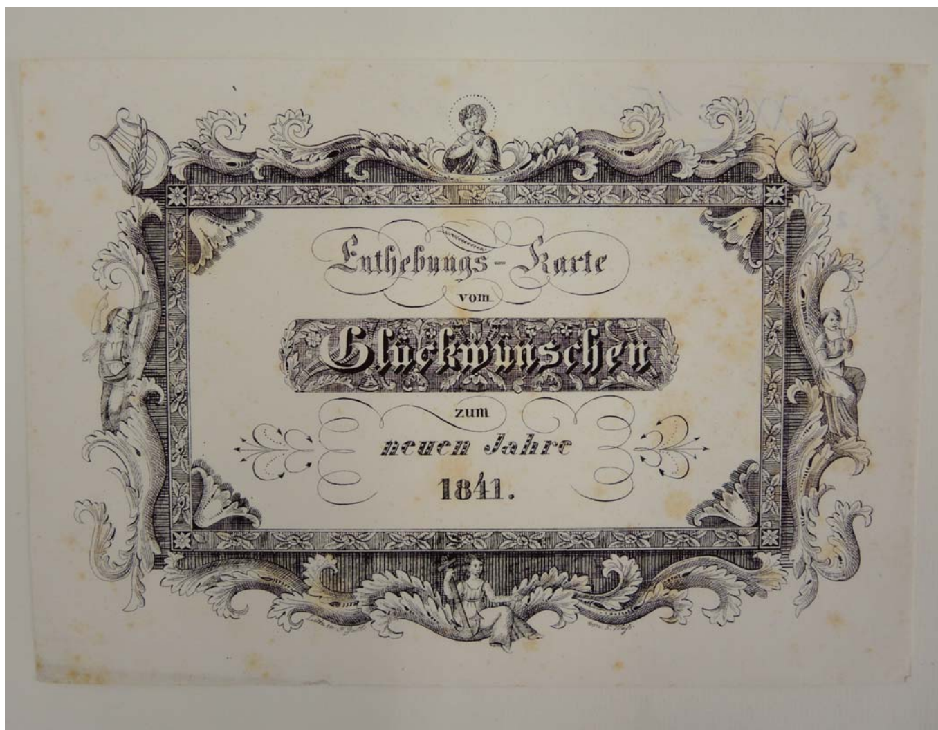
Obr. 5. Novoročenka vytištěná v kamenotiskárně Franze Gastla. WEISS, E. Enthebungs-Karte von Glückwünschen zum neuen Jahre 1841. Brünn: Lith. bei F. Gastl, 1840. AMB, U 25, inv. č. 454, XXII c 15/10.

V kamenotiskárně bratří Trasslerů byly příležitostně vydávány také volné grafické listy či soubory litografií zachycující oblíbená témata, ať již se jednalo o historické scény, obrazy z románů, veduty či drobnou, zejména devoční grafiku. Oblíbené byly také série i jednolisty vydávané k různým příležitostem a nabízené jako příhodné dárky k životním výročí či Vánocům. „Zwölf Blätter zu de la Motte Fouqué's Undine , nach Schulze lithographirt von Lhok. quer 4. Preis: 1 Rthlr. 8 Gr. Acht Blätter zu Schillers Fridolin oder der Gang nach dem Eisenhammer , nach Retzsch lithogr. von Lhok. Preis: 14 Gr. Kupfersammlung zu Walter Scotts sämtlichen Werken Isle Lieferung in 4 Blättern lithographirt. Preis: 10 Gr. Diese Gegenstände eignen sich vorzüglich zu kleinen Geschenken zu Weihnachten oder zu jeder andern passenden Gelegenheit.“ 32 Na realizaci těchto grafických listů se pak podílel jak vlastní personál litografické dílny, tak i najímaní umělci.