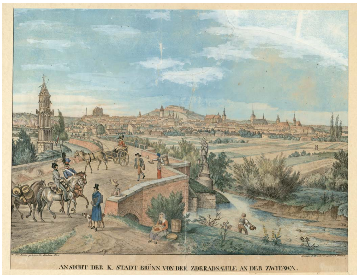
Obr. 3. RICHTER, Franz. Ansicht der K. Stadt Brünn von der Zderadsaeule an der Zwitawa. Nach der Natur gez. von Fr. Richter. No. 1. Steindr. d. Brüder Trassler in Brünn. Brno 1829. MZK, Skř. 91.416,60.

obálce zachycují pouze Židovskou bránu, Zderadův sloup a průčelí starobrněnské radnice.