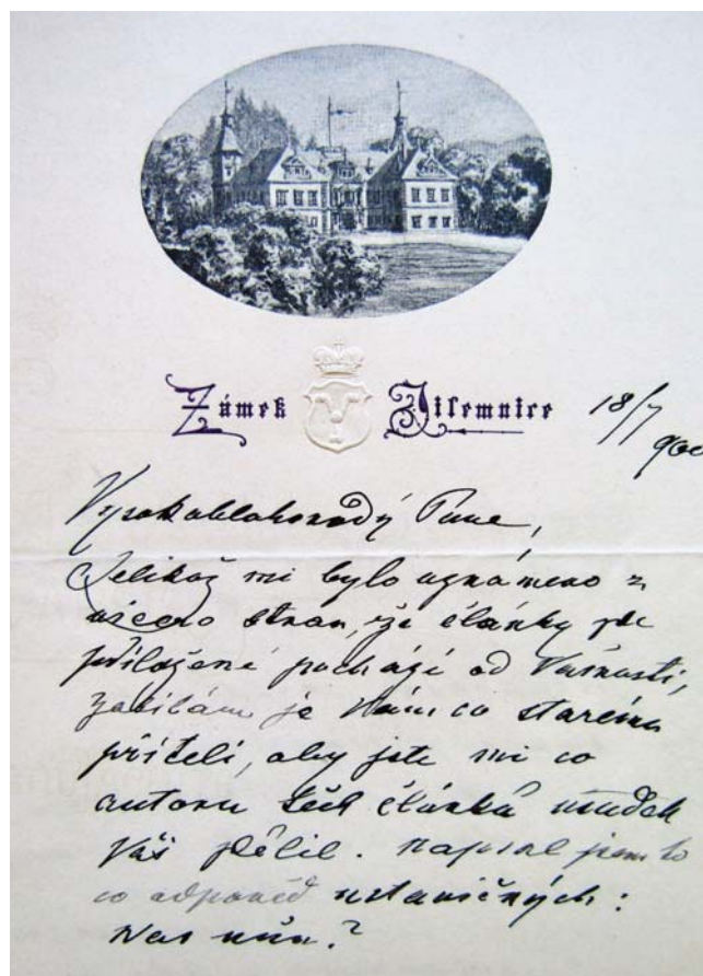
Obr. 5. Harrachův dopis Riegrovi, ANM Praha, fond. Fr. L. Rieger, kart. 29.

Jeho nasazení bylo nezřídka mimořádné a mohlo mu přinést (a občas i přinášelo) nepříjemnosti. Dejme ale slovo přímo hraběti: