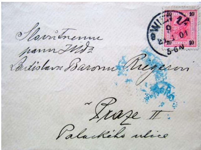
Obr. 2. Obálka dopisu adresovaného Riegrovi, ANM Praha, fond Fr. L. Rieger, kart. 29.