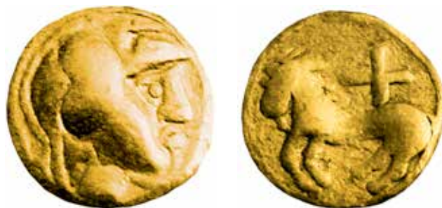
● 1: \frac{1}{3} statéru z Polkovic, typ Athéna / kůň s křížem .

MILITKÝ, J.: Keltské mincovnictví , č. IV:01.